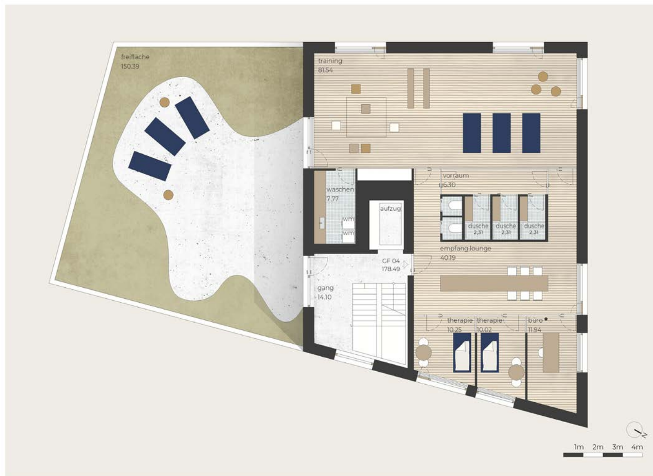
BÜRO GRUNDRISS OBERGESCHOSS 02

Sie suchen Räumlichkeiten mit hochwertiger Ausstattung, ein besonderes Ambiente und einen Kraftort für nachhaltige Gesundheit?