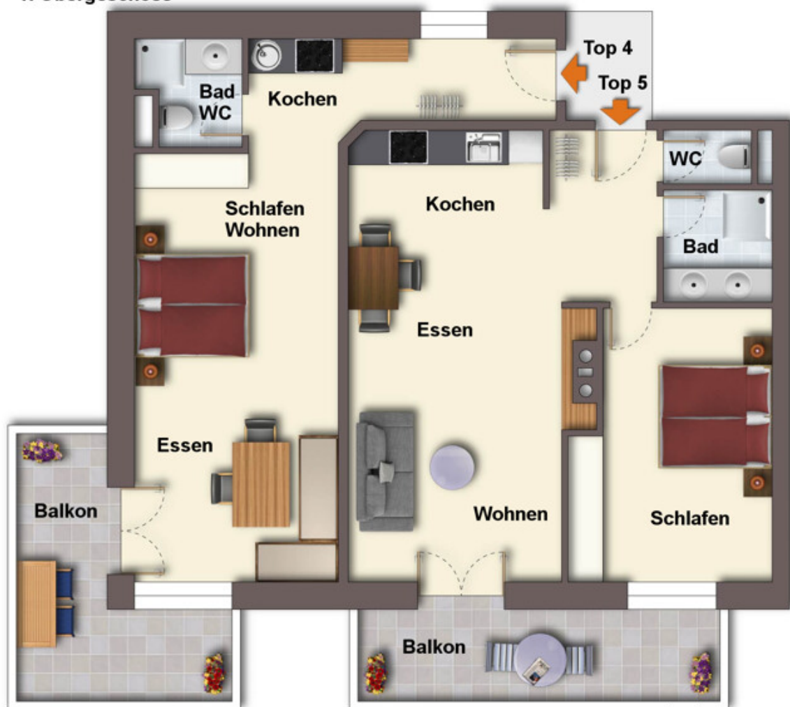
Grundriss ohne Maßstab!