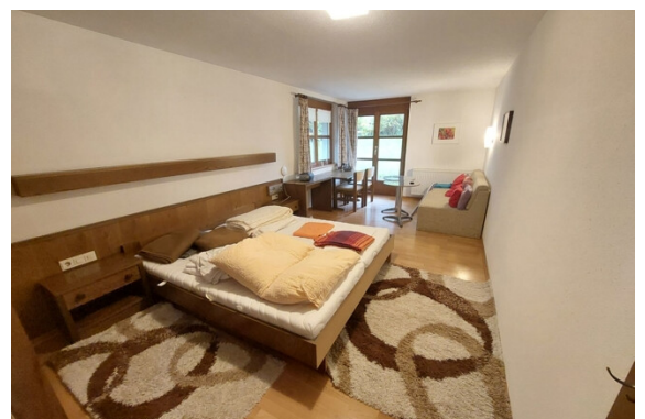
Wohnen / Schlafen