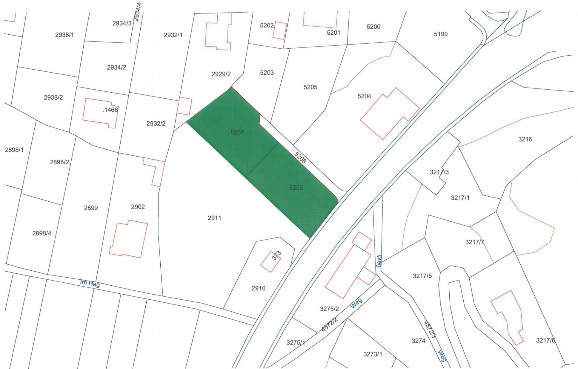
ÜBERSICHTSPLAN M 1:1000