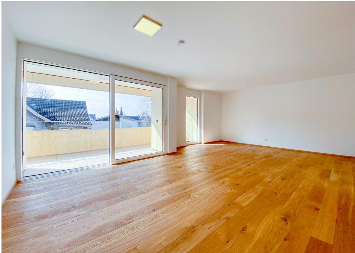
Wohnraum beim Erstbezug