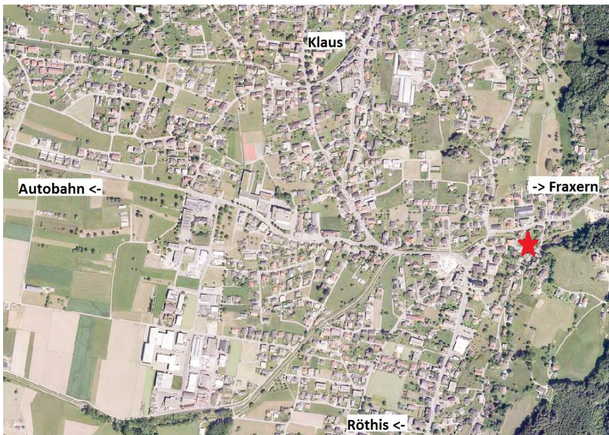
Anfahrts- und Lageplan