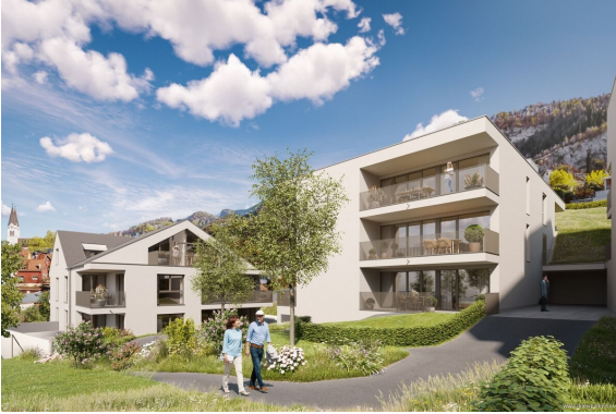
Ansicht | Haus 1+2