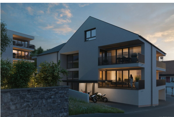
Ansicht | Haus 1+2