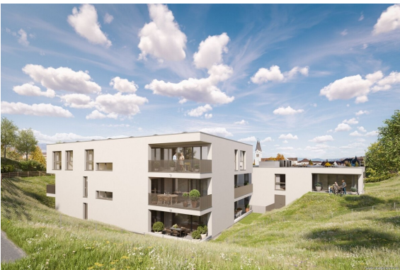
Rückansicht | Haus 2+3