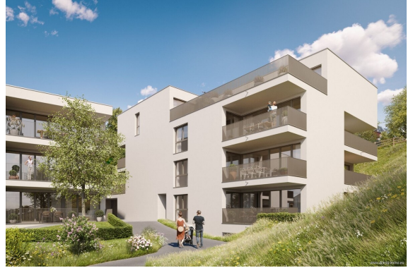
Ansicht | Haus 2+3