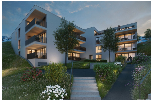
Ansicht | Haus 2+3