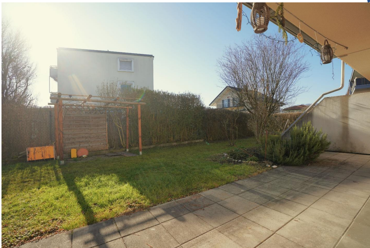
Garten und Terrasse