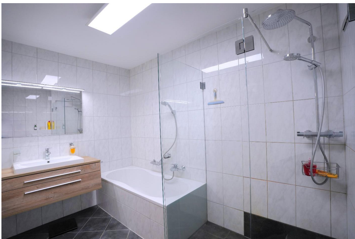
Badezimmer mit Badewanne, Dusche und WC

Immobilientreuhandbüro, Kaiser-Franz-Josef-Str. 15a, 6890 Lustenau T +43 660 6065250, office@mietplus.at, www.mietplus.at