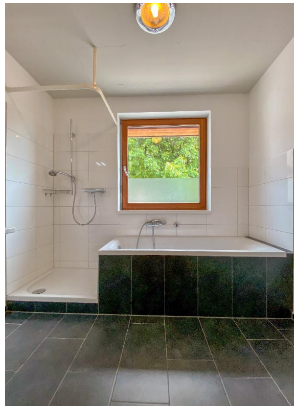
... Dusche & Wanne