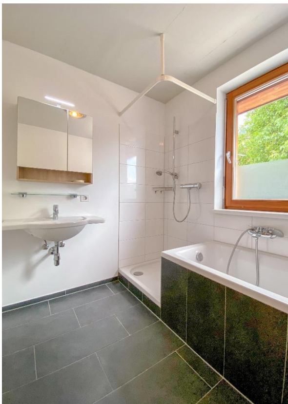
Bad mit Fenster...