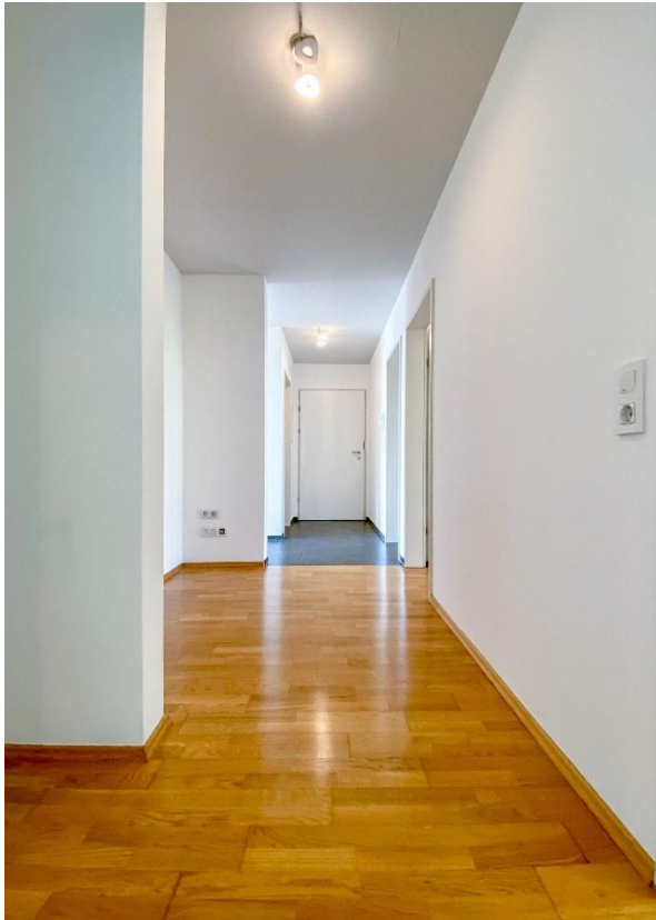
Diele / Flur / Garderobe