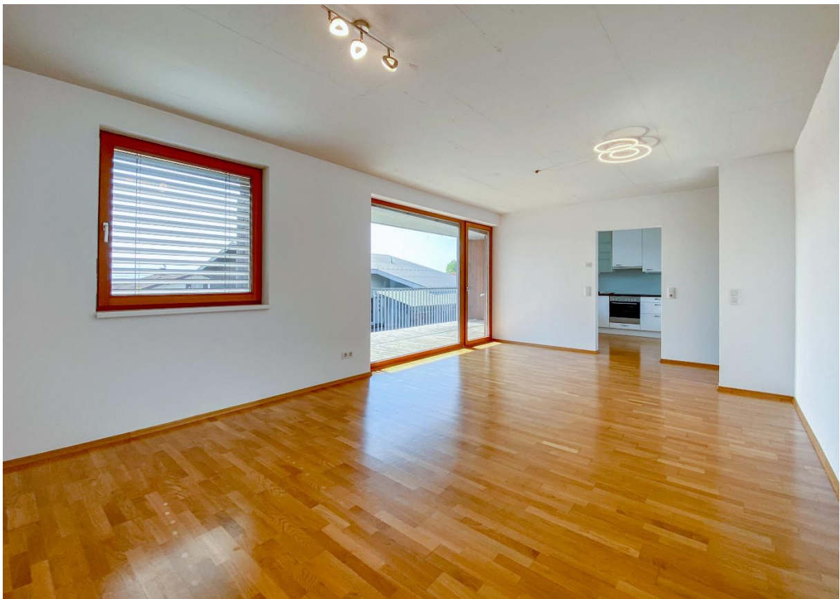
Wohnen / Essen