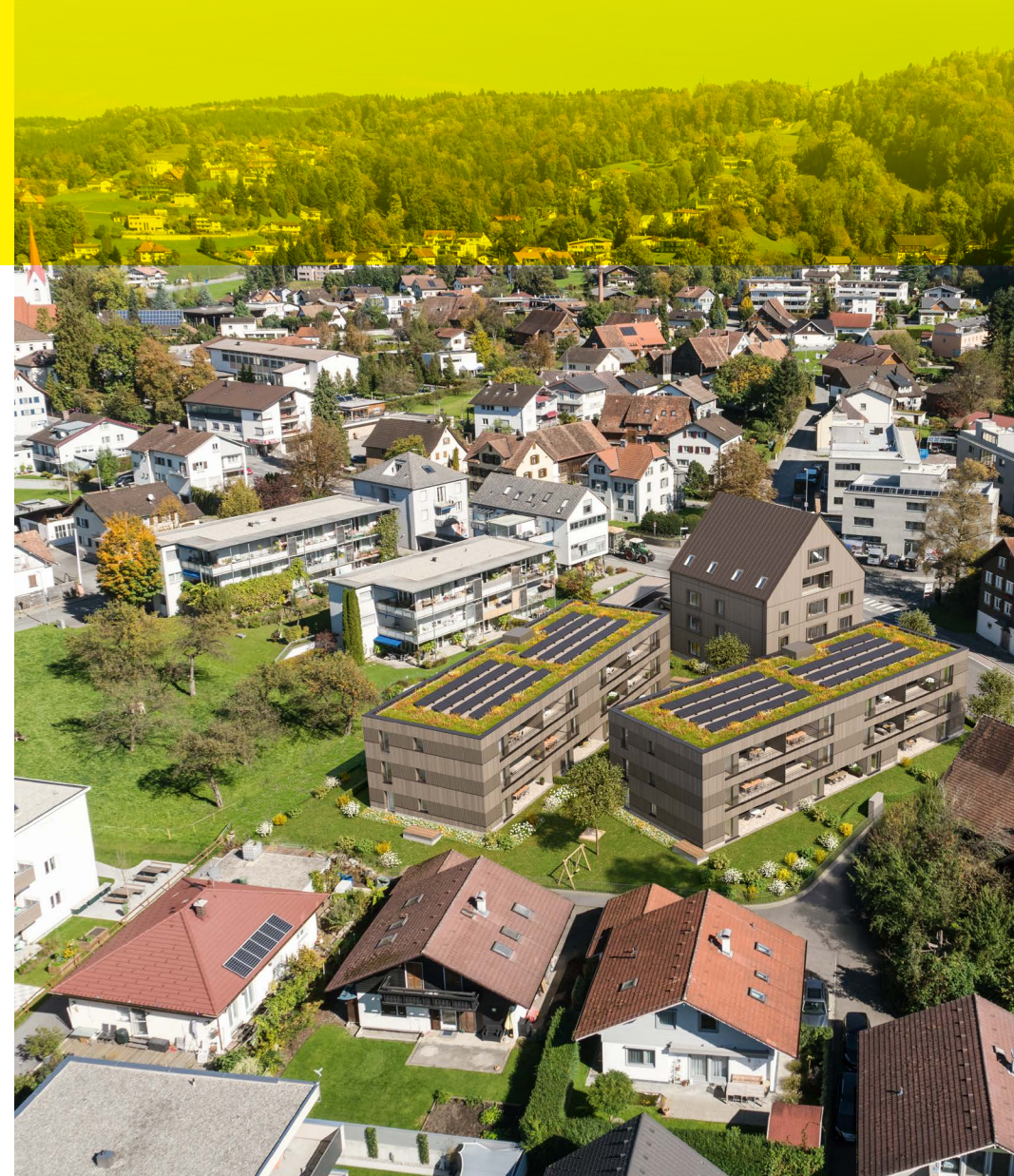
Dornbirn: eine Stadt zum Leben, Wohnen, Arbeiten Vom Karren bis zum Marktplatz hat die größte Stadt im Rheintal einiges zu bieten.