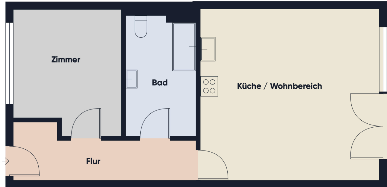
Grundrissplan ohne Maßstab