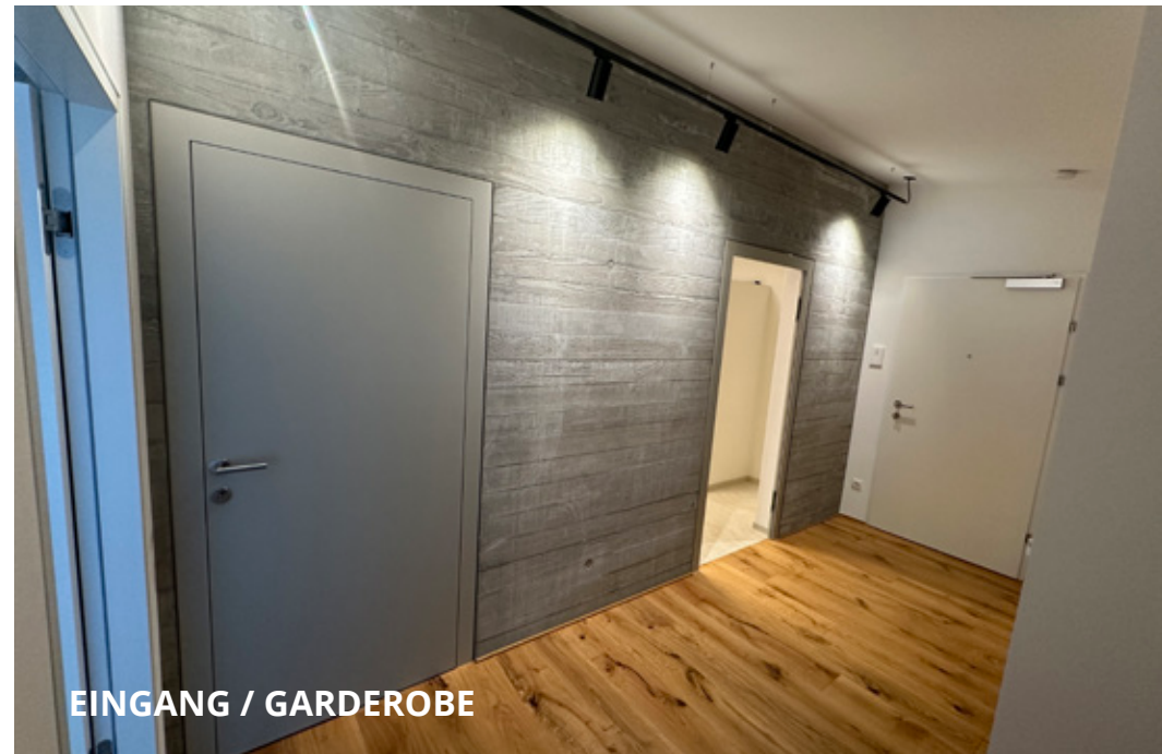
EINGANG / GARDEROBE