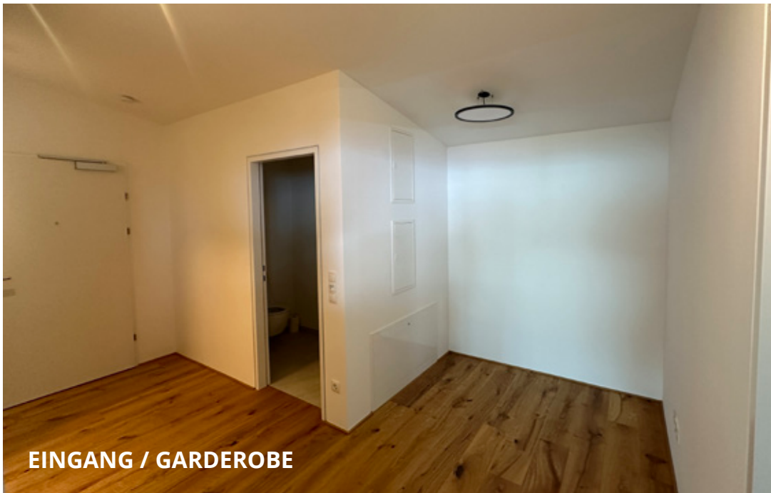
EINGANG / GARDEROBE