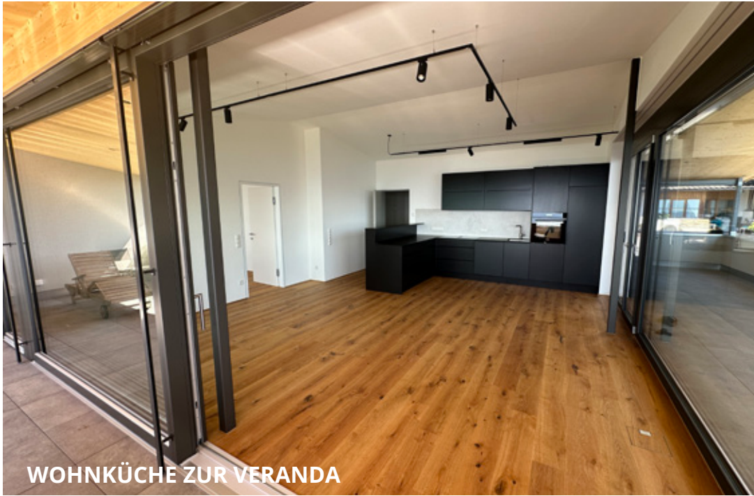
WOHNKÜCHE ZUR VERANDA