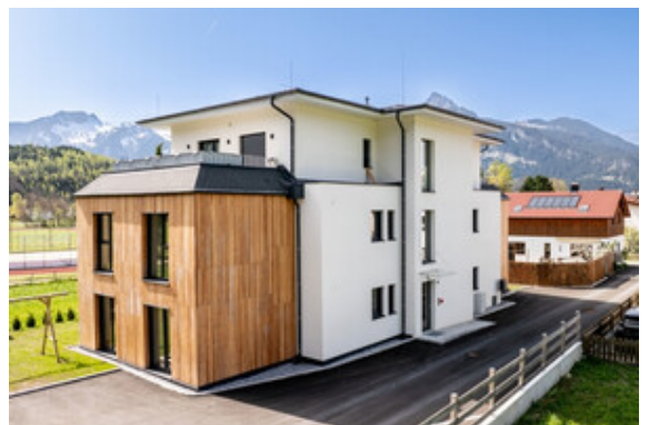
Außenansicht Haus A