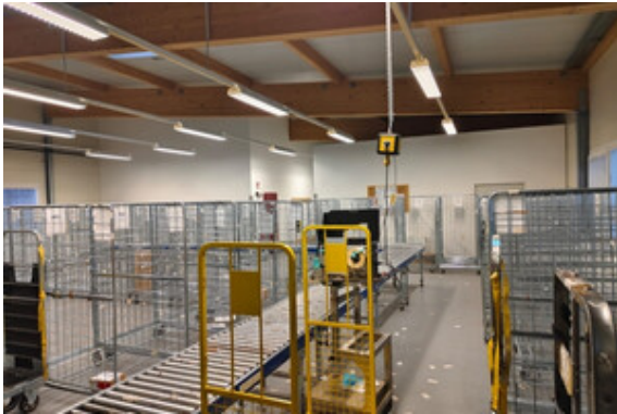
Halle | Lager