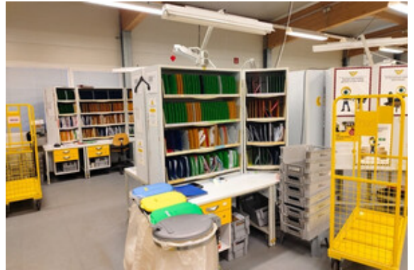
Halle | Lager