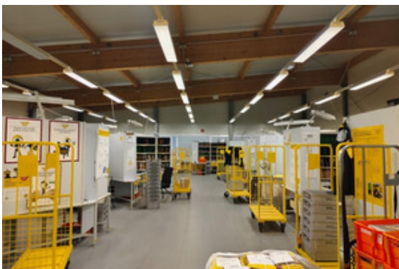
Halle | Lager