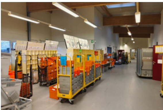
Halle | Lager