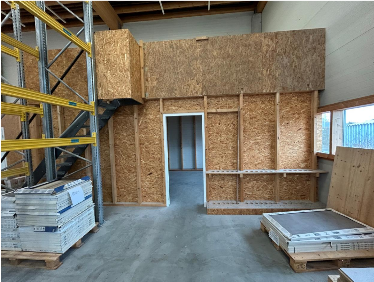
Eingang zur Küche / Nebenraum