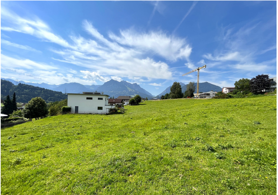
Ausblick nach Süden