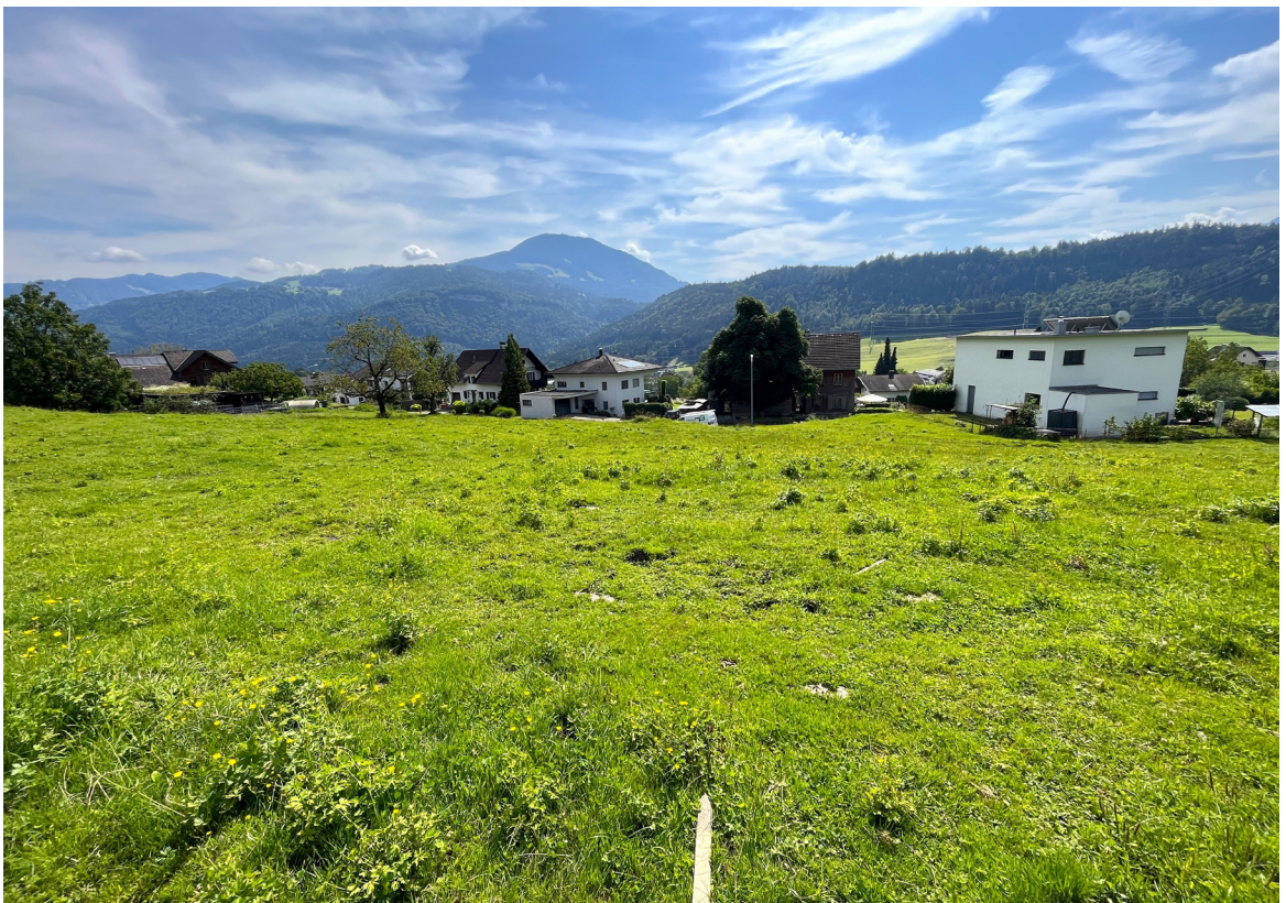
Ausblick nach Osten