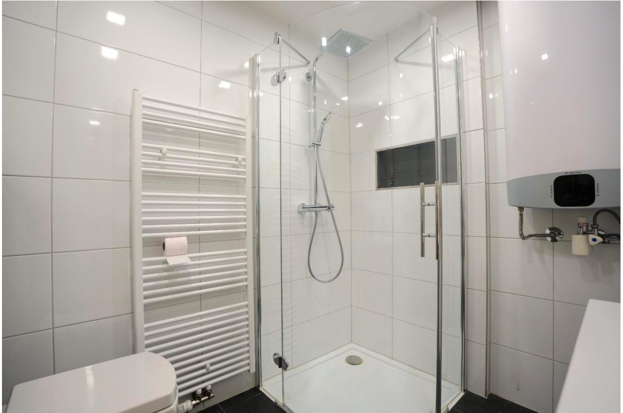
Badezimmer mit Dusche und WC