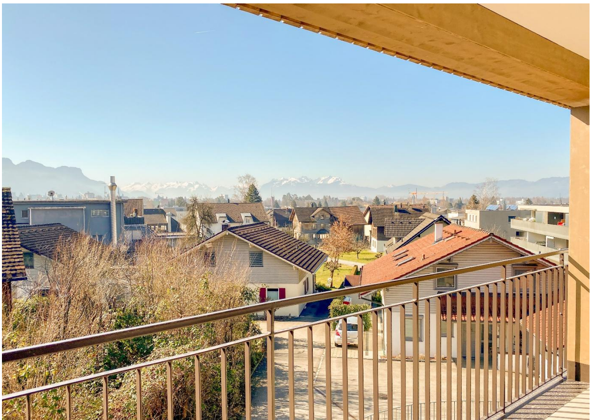
Ausblick in die Schweizer Berge