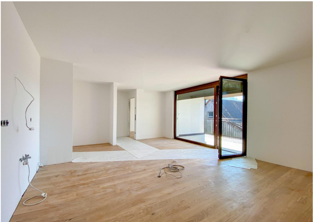
Platz für die Kochinsel