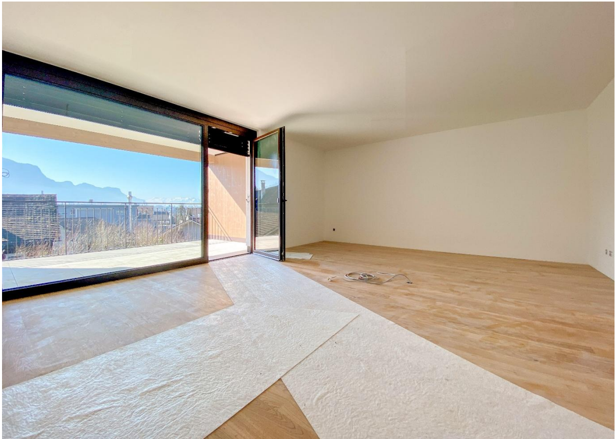
Kochen / Essen / Wohnen