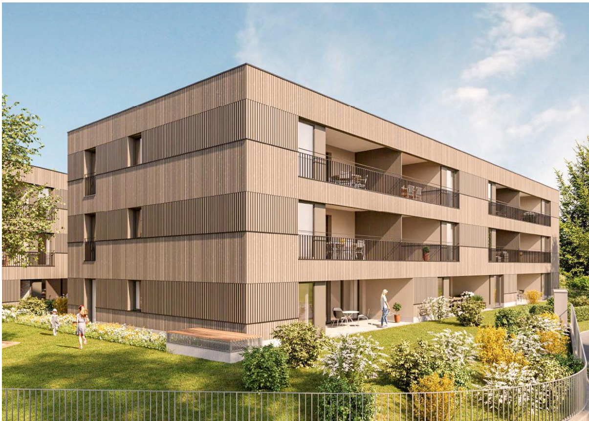
Ansicht Südwest - Animation