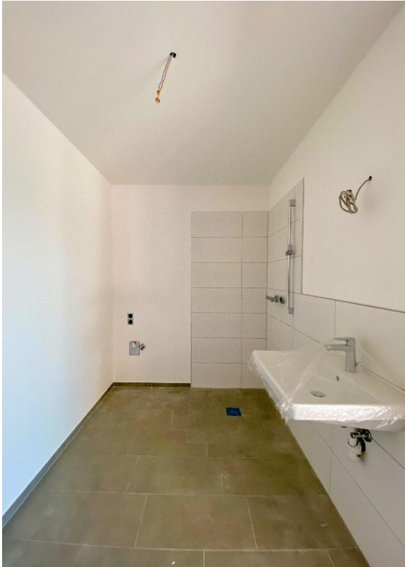
Badezimmer mit walk in Dusche