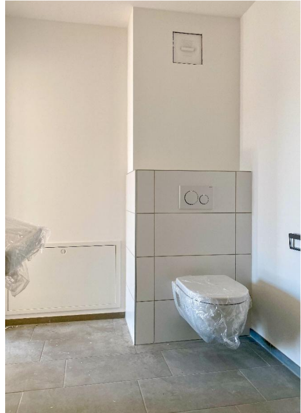
und integriertem WC