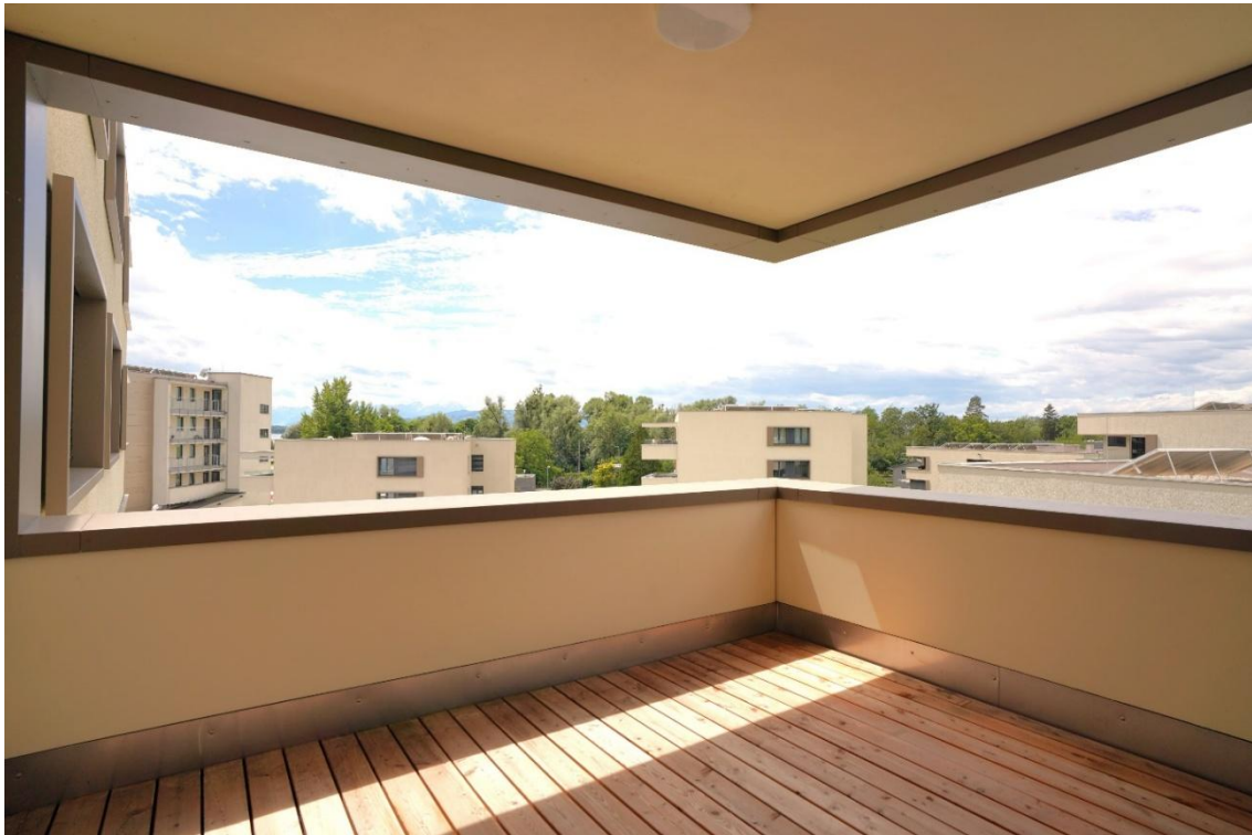
Balkon, Ansicht 1