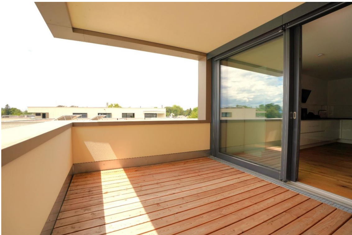
Balkon, Ansicht 2