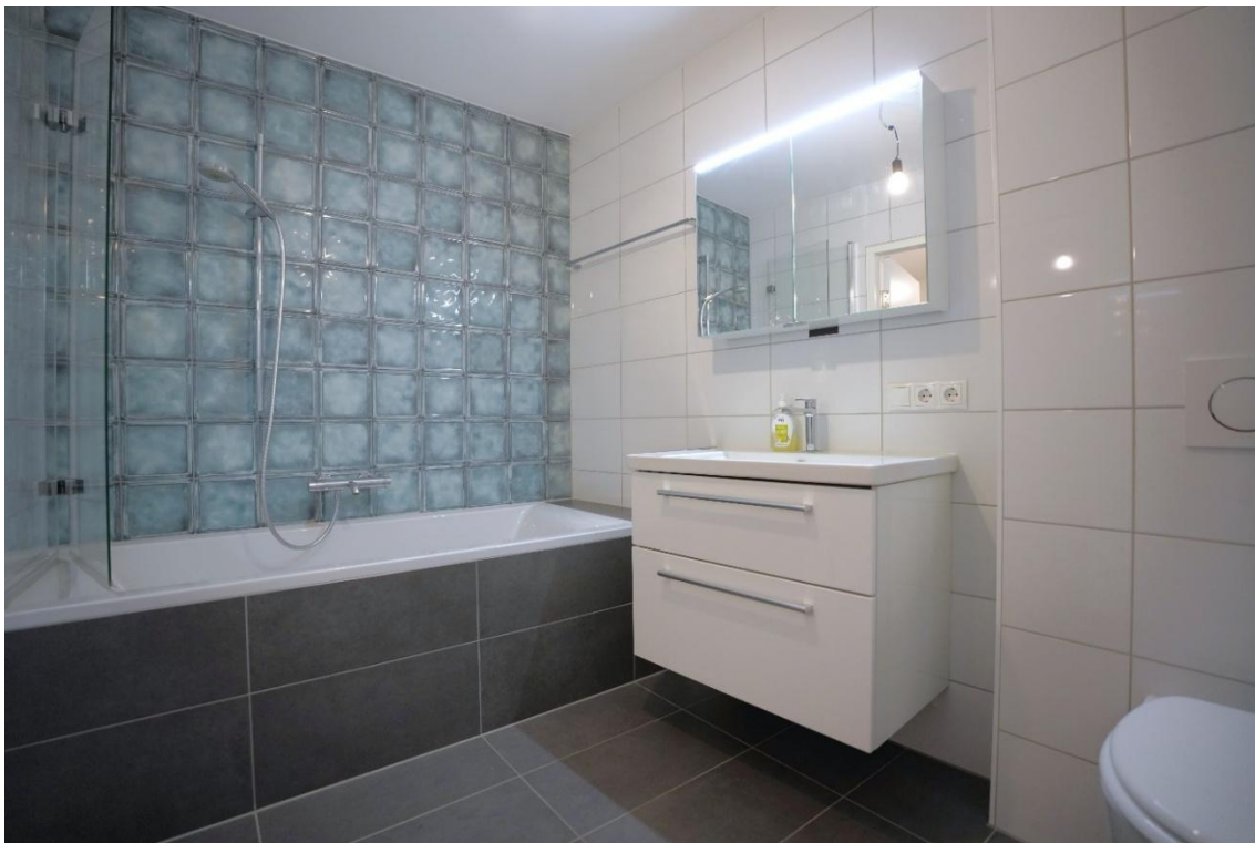
Badezimmer mit Badewanne und WC