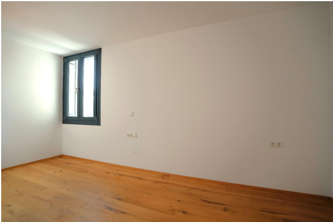
Schlafzimmer, Ansicht 1