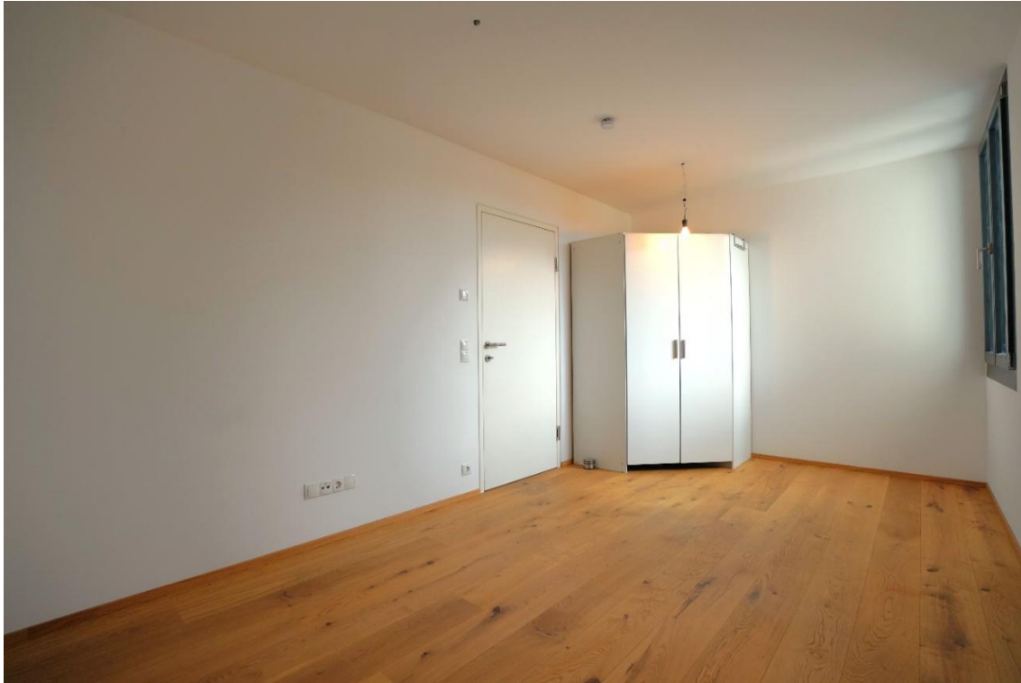
Schlafzimmer Ansicht 2