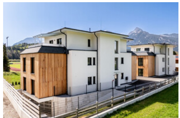
Außenansicht / Tiefgarageneinfahrt