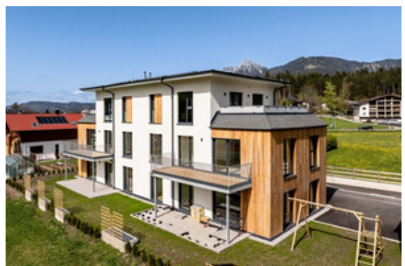
Außenansicht Haus A