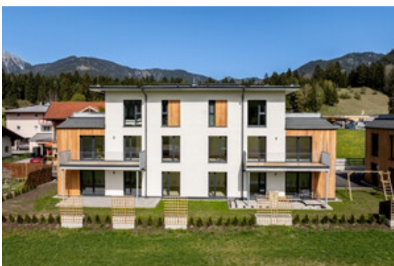
Außenansicht Haus A