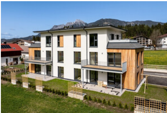
Außenansicht Haus A