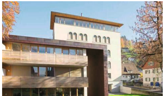
↑ Magazin Oberdorf, Dornbirn