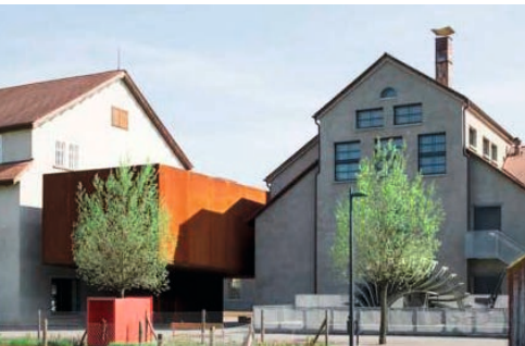
↑ Inatura, Dornbirn