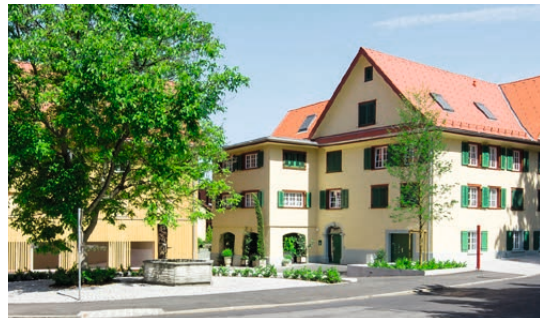
↑ Kirchgasse, Dornbirn