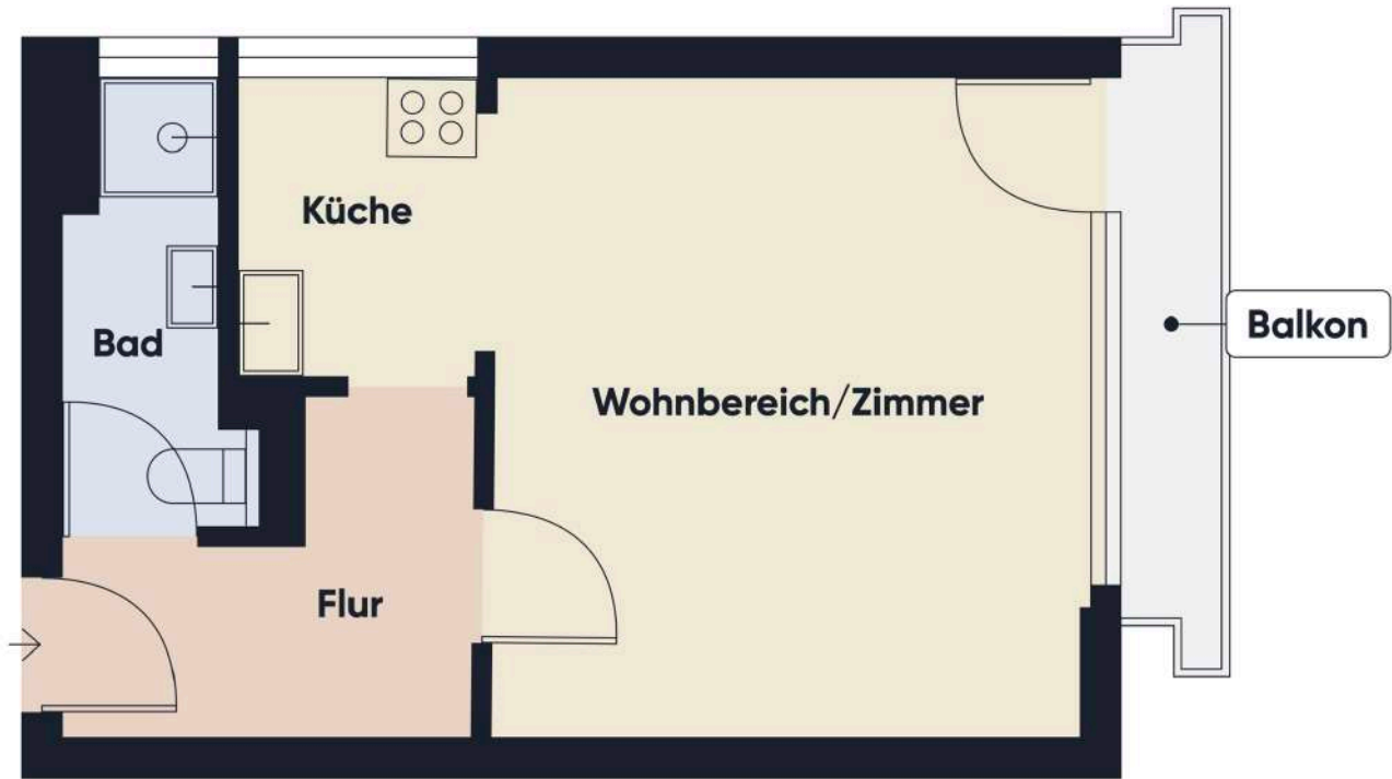
Grundrissplan ohne Maßstab