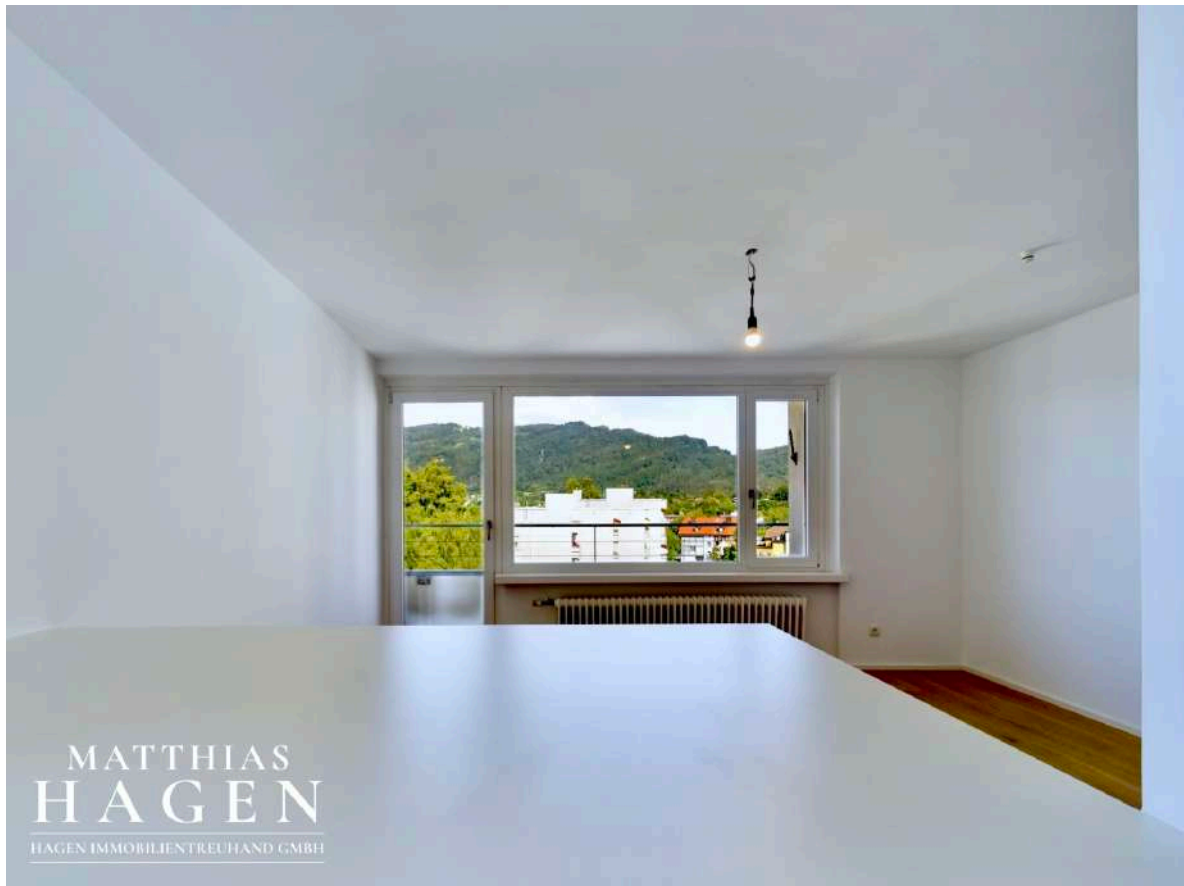
Blick in den Wohnbereich