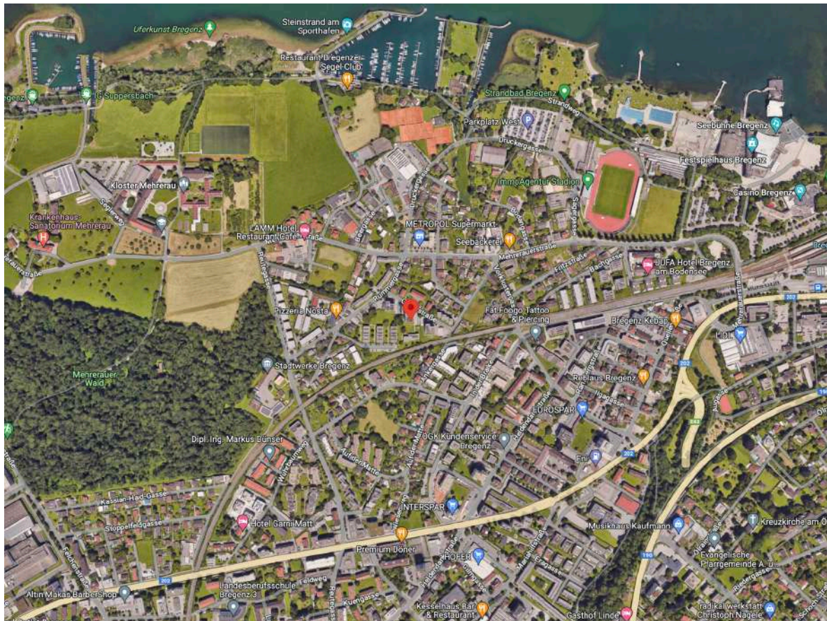
Infrastruktur Quelle Google Maps