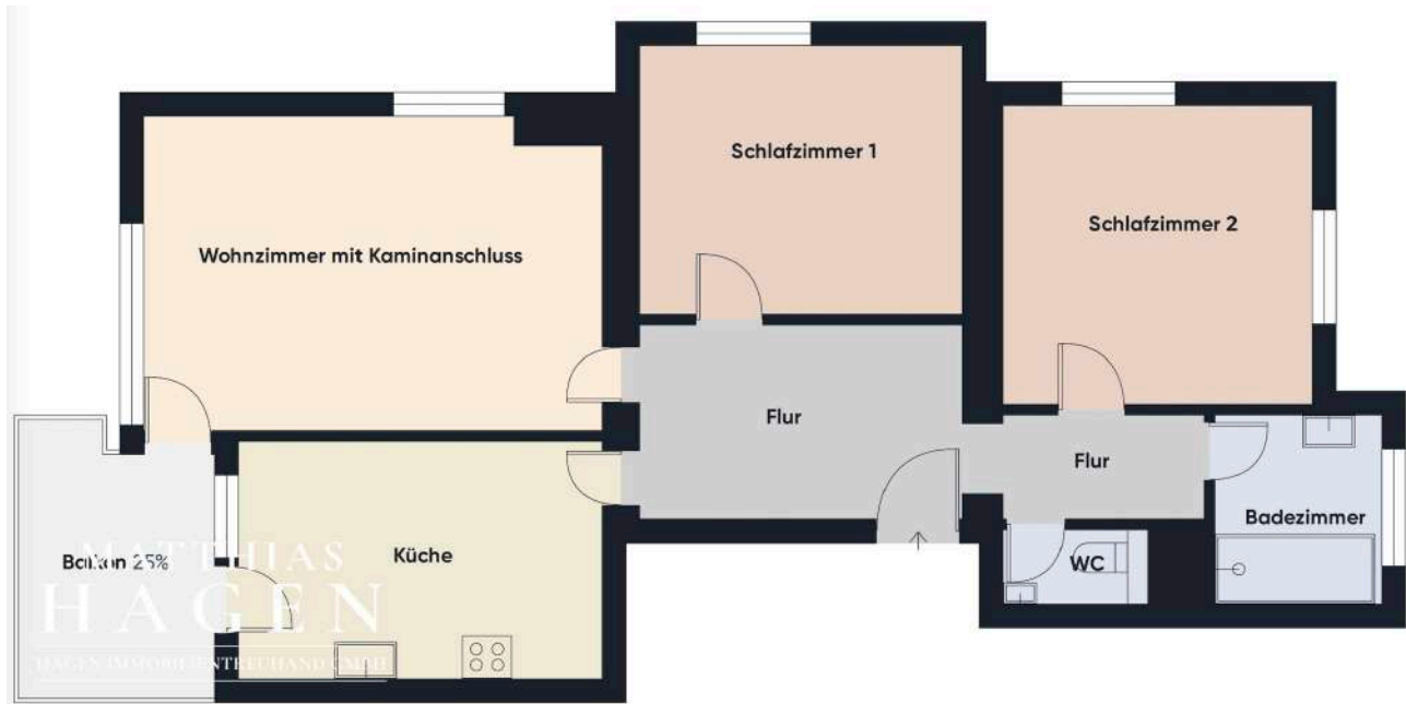
Grundriss ohne Maßstab