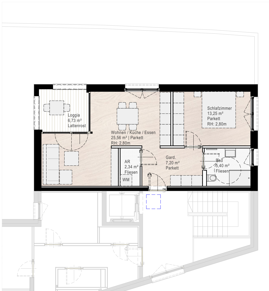
Grundriss 2. Obergeschoss

0 1 5 Planmaßstab im A4 Druckformat: 1:100 Planstand: 21.01.2024