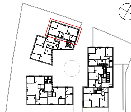
Übersicht 2. Obergeschoss

Einrichtungen (strichliert dargestellt) sind nicht Teil des Vertrages. Ausstattung laut gültiger Bau- und Ausstattungsbeschreibung. Flächen können +/-3% abweichen. Abmessungen sind Rohbaumaße. Für Einbaumöbel sind Naturmaße zu nehmen.