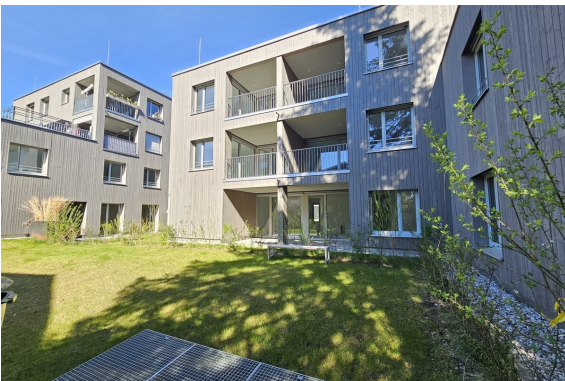
Außenansicht | Gemeinschaftsgarten