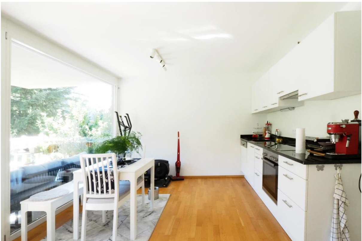
Kochen / Essen