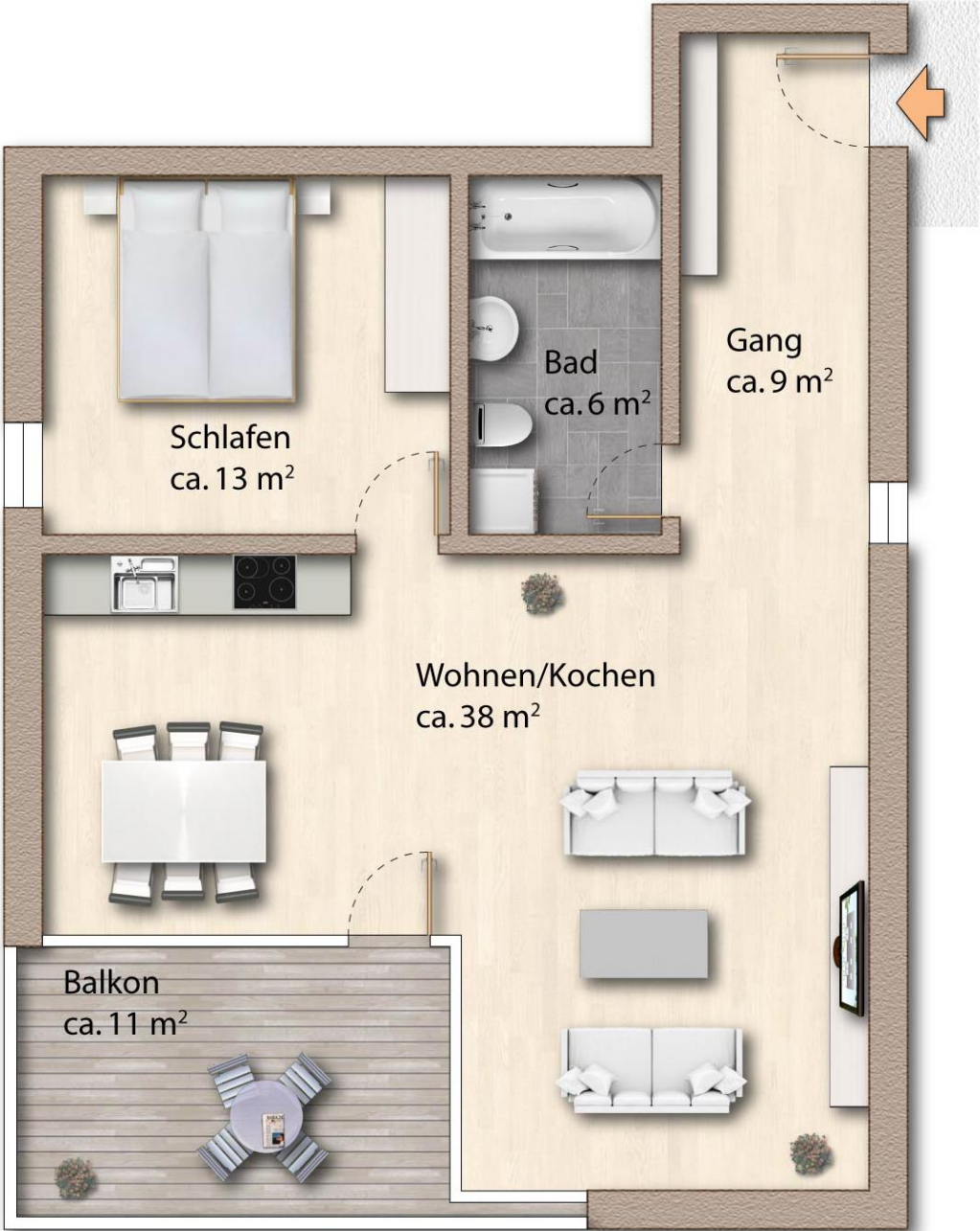
Grundriss mit ca. Maßangaben