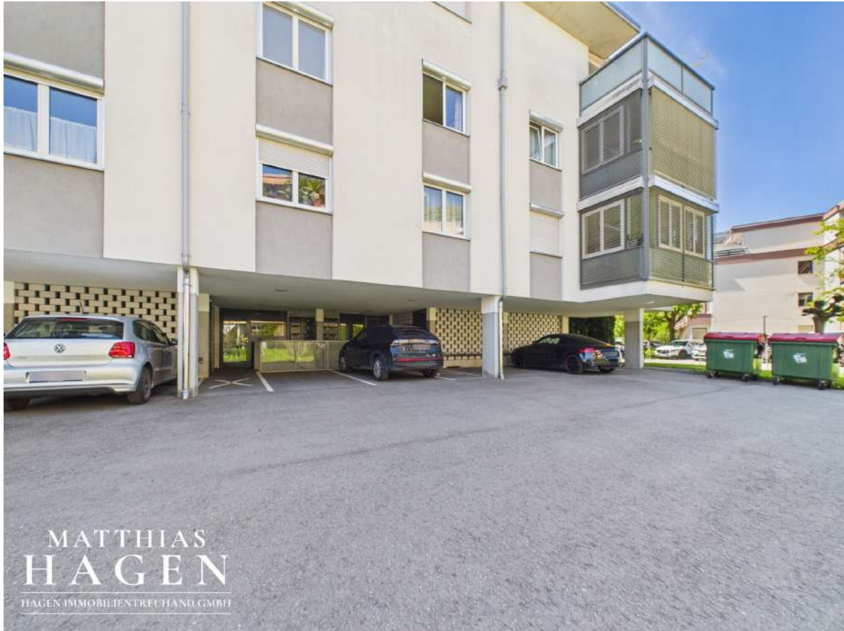
Haus und Besucherparkplätze