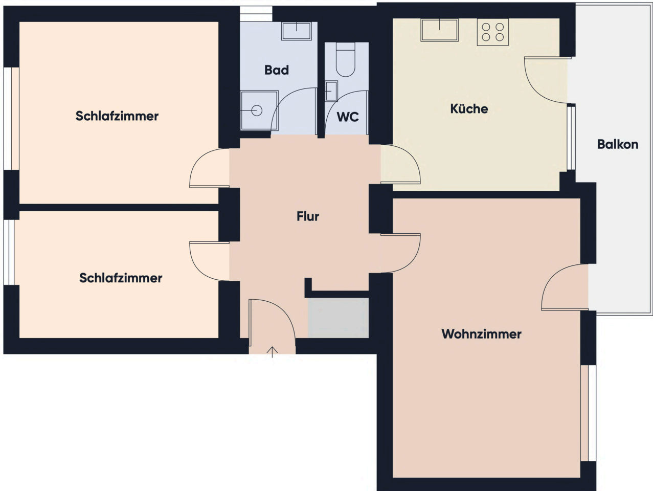
Grundrissplan ohne Maßstab