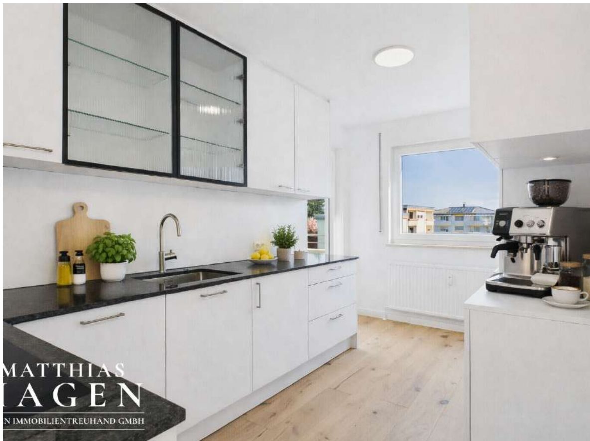
Küche mit Einrichtungsvorschlag