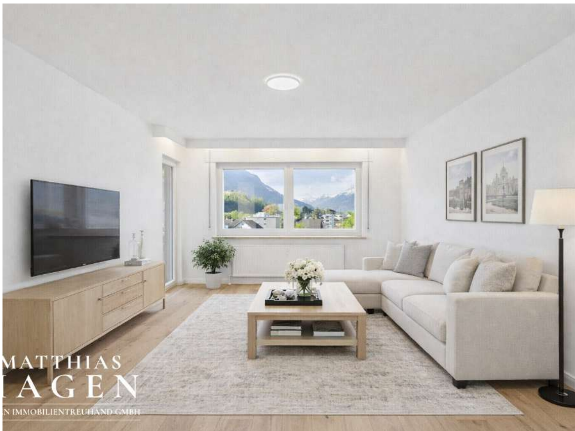
Wohnbereich mit Einrichtungsvorschlag