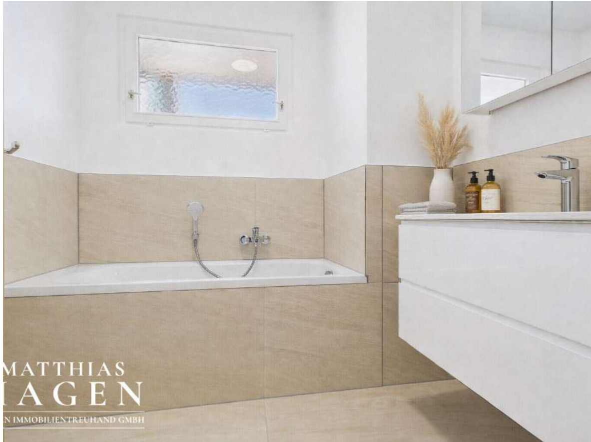
Badezimmer mit Einrichtungsvorschlag