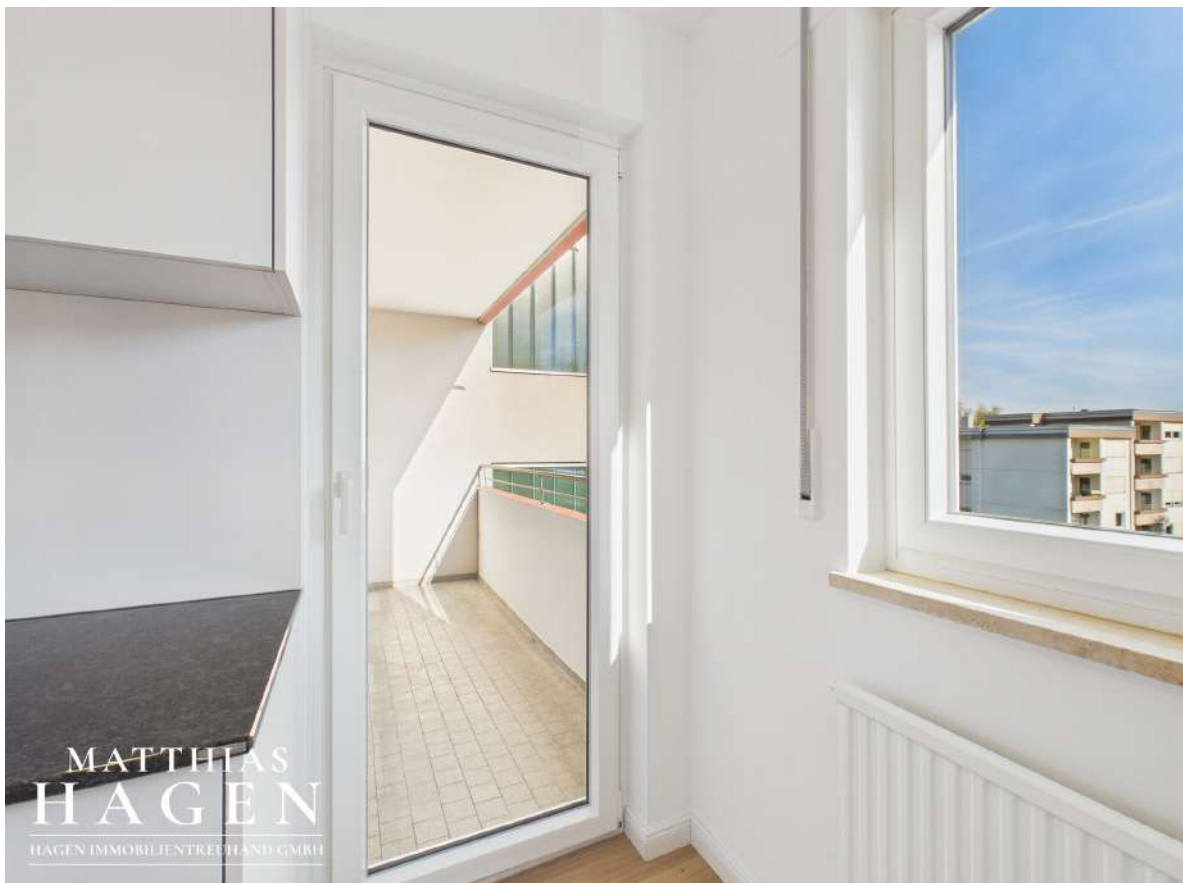
Zugang Balkon 2