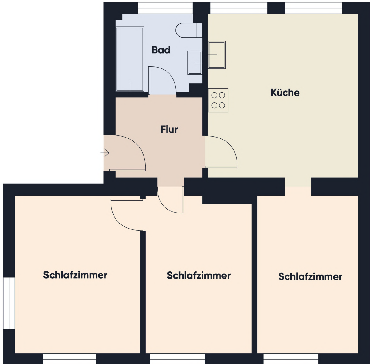
Grundrissplan ohne Maßstab