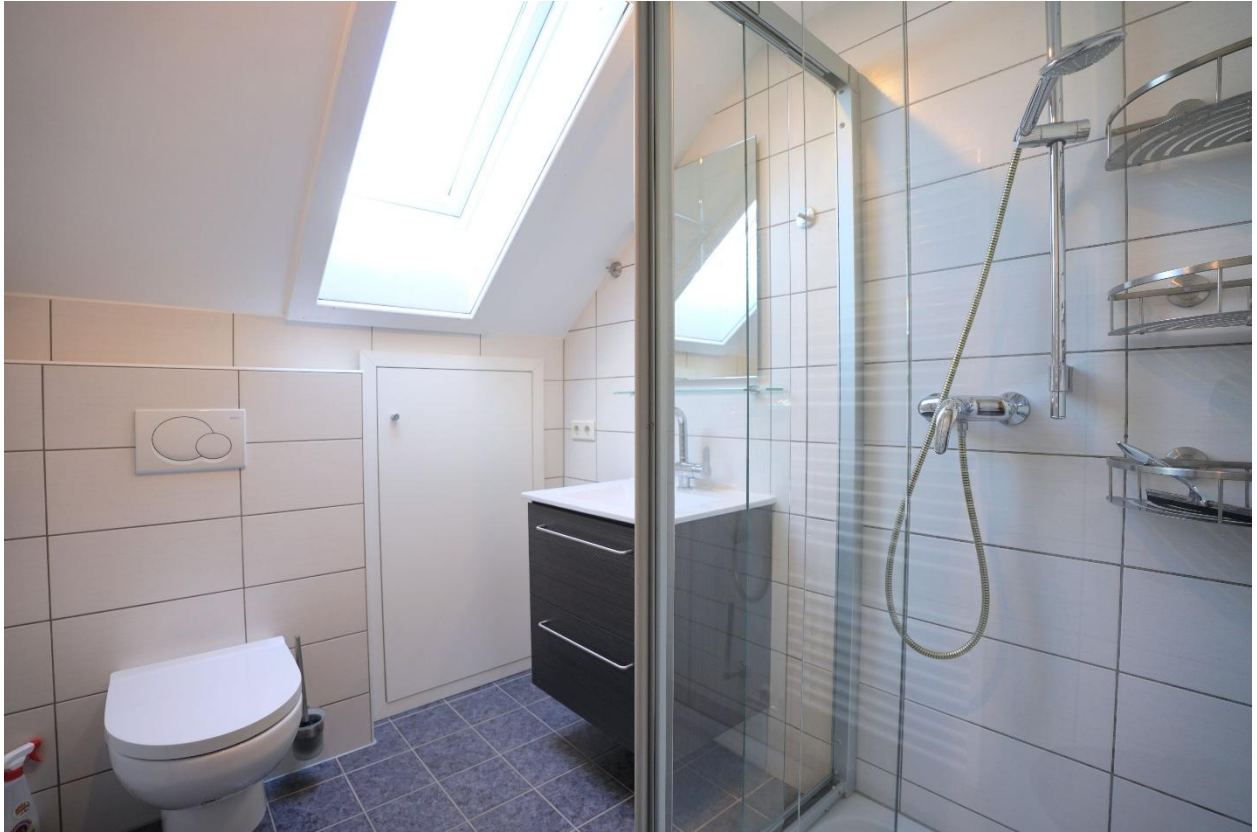
Badezimmer mit Dusche und WC