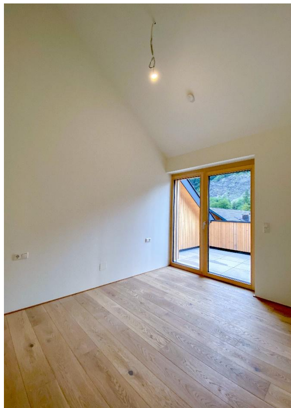
und Dachschräge bis zum First