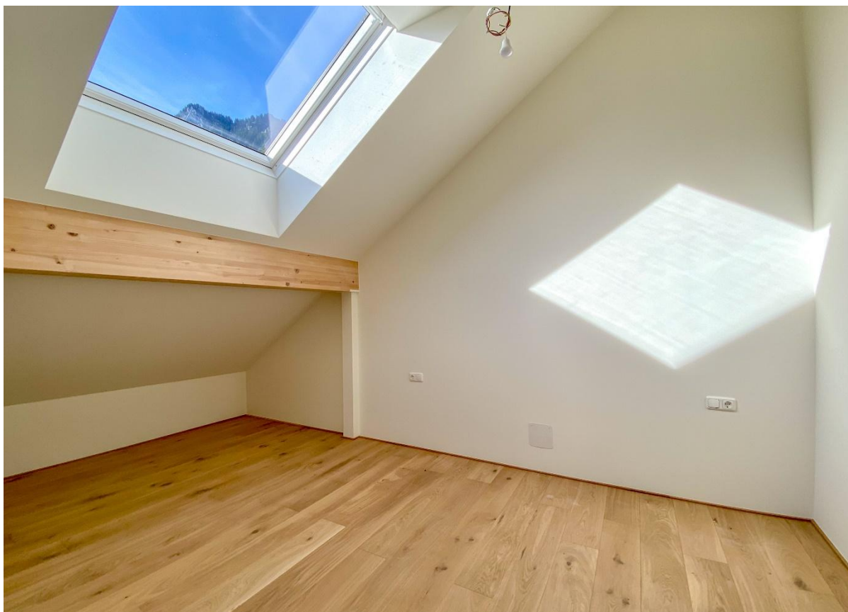
Schlafzimmer 2 .....