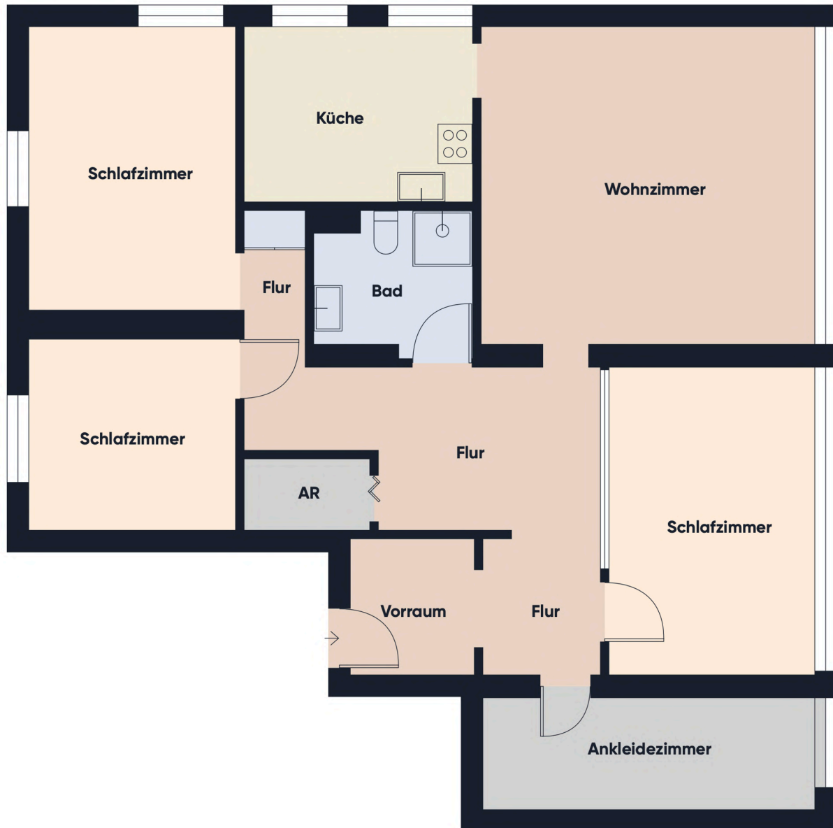
Grundrissplan ohne Maßstab