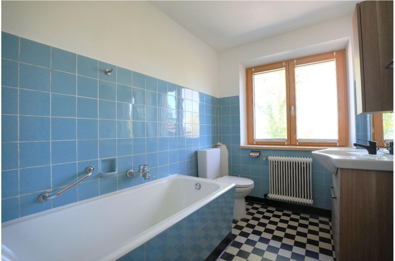
Badezimmer mit Badewanne und WC