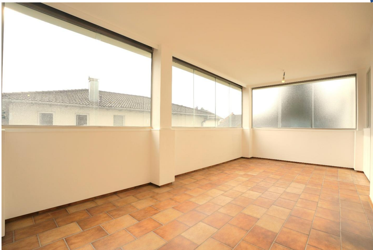
verglaster Balkon (Zugang vom Wohnzimmer, der Küche und vom Schlafzimmer)