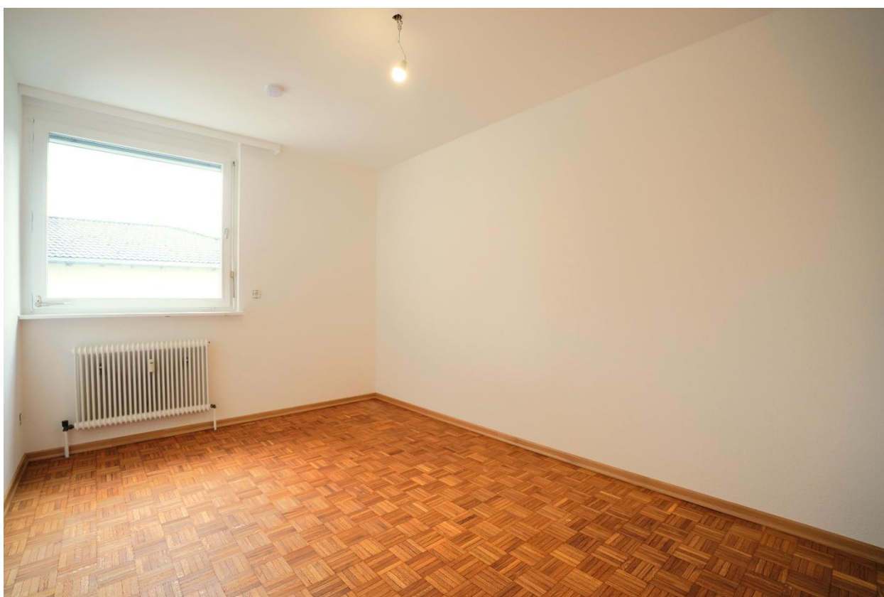
Kinderzimmer / Büro