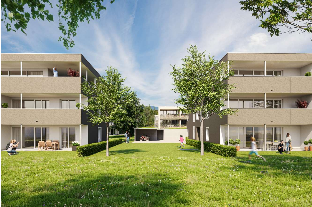
Haus A rechts, Haus B links