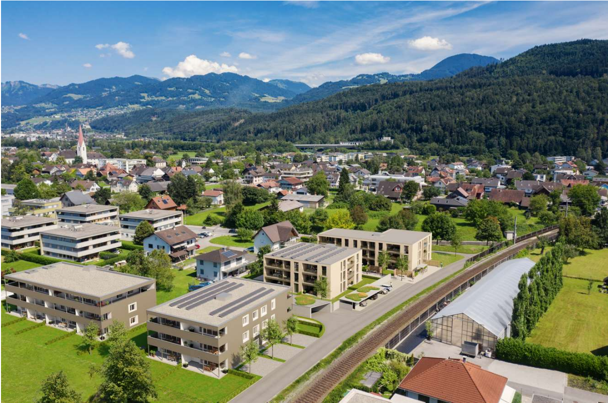
Haus A rechts, Haus B links