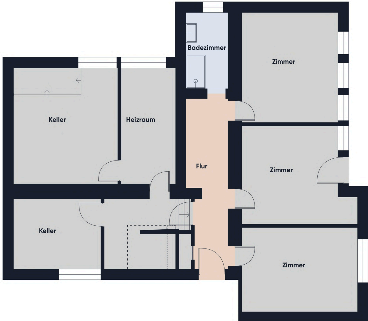
Grundrissplan UG ohne Maßstab