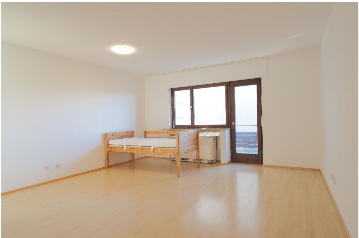
Wohnen / Essen / Schlafen