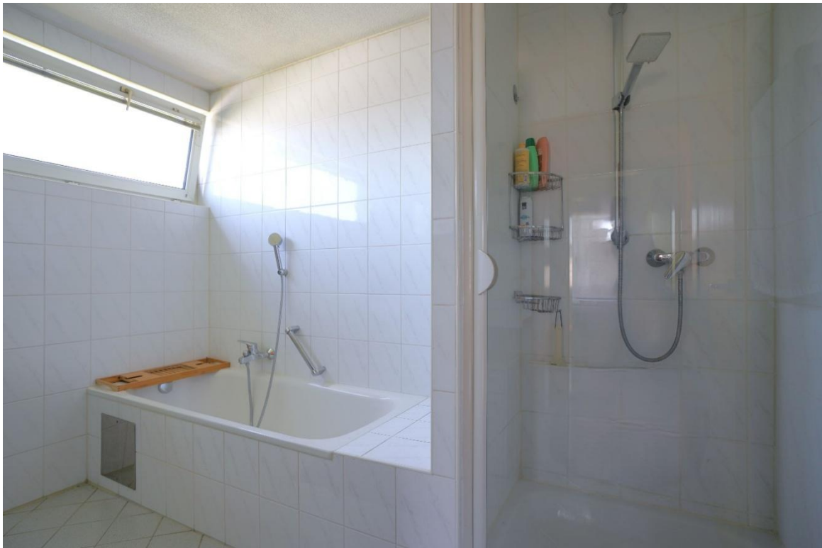
Badezimmer mit Dusche und Badewanne