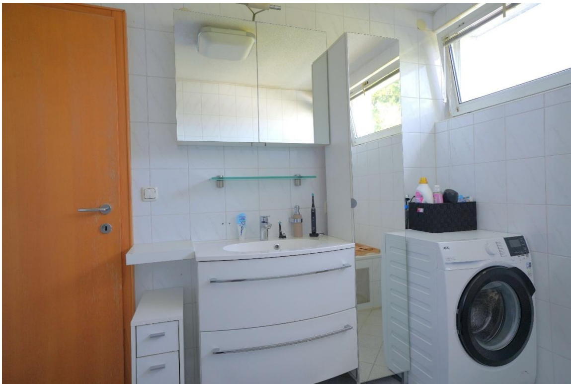
Badezimmer mit Dusche und Badewanne