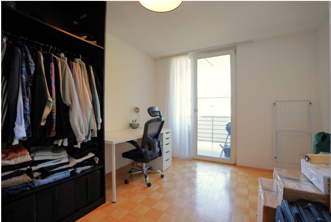
Kinderzimmer / Büro