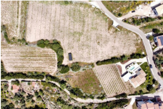
Luftaufnahme / Gesamtgrundstück