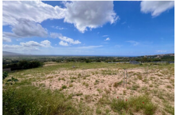
Grundstück mit Tiefbrunnen