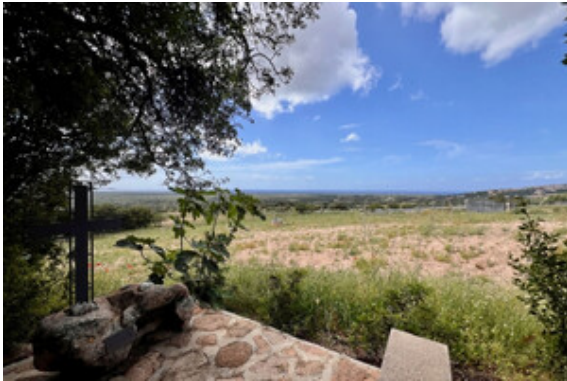
Grundstück mit Tiefbrunnen