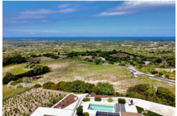
Aussicht / Meerblick