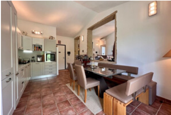
Kochen / Essen