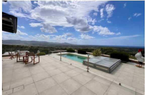
Terrasse / Pool