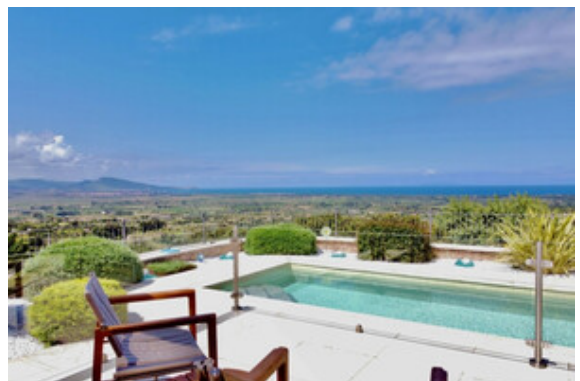
Pool mit Meerblick