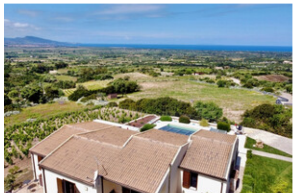
Aussicht / Meerblick