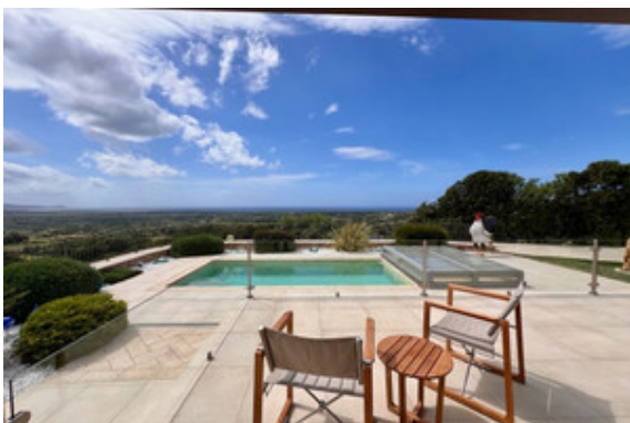
Terrasse / Pool