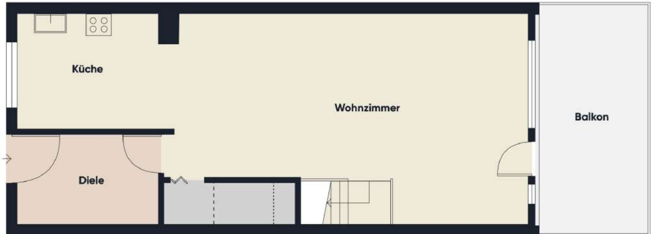
Grundrissplan ohne Maßstab untere Wohnebene