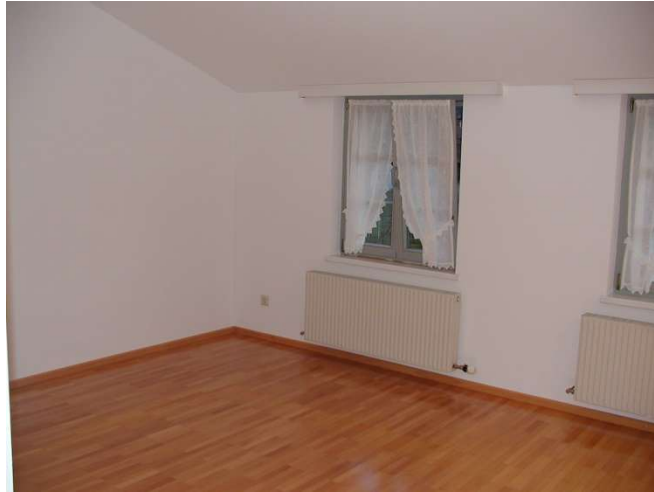
TOP 4 66,6 m 2 Nfl.