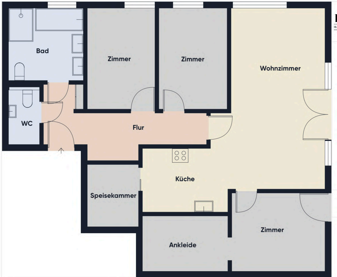
Grundrissplan ohne Maßstab