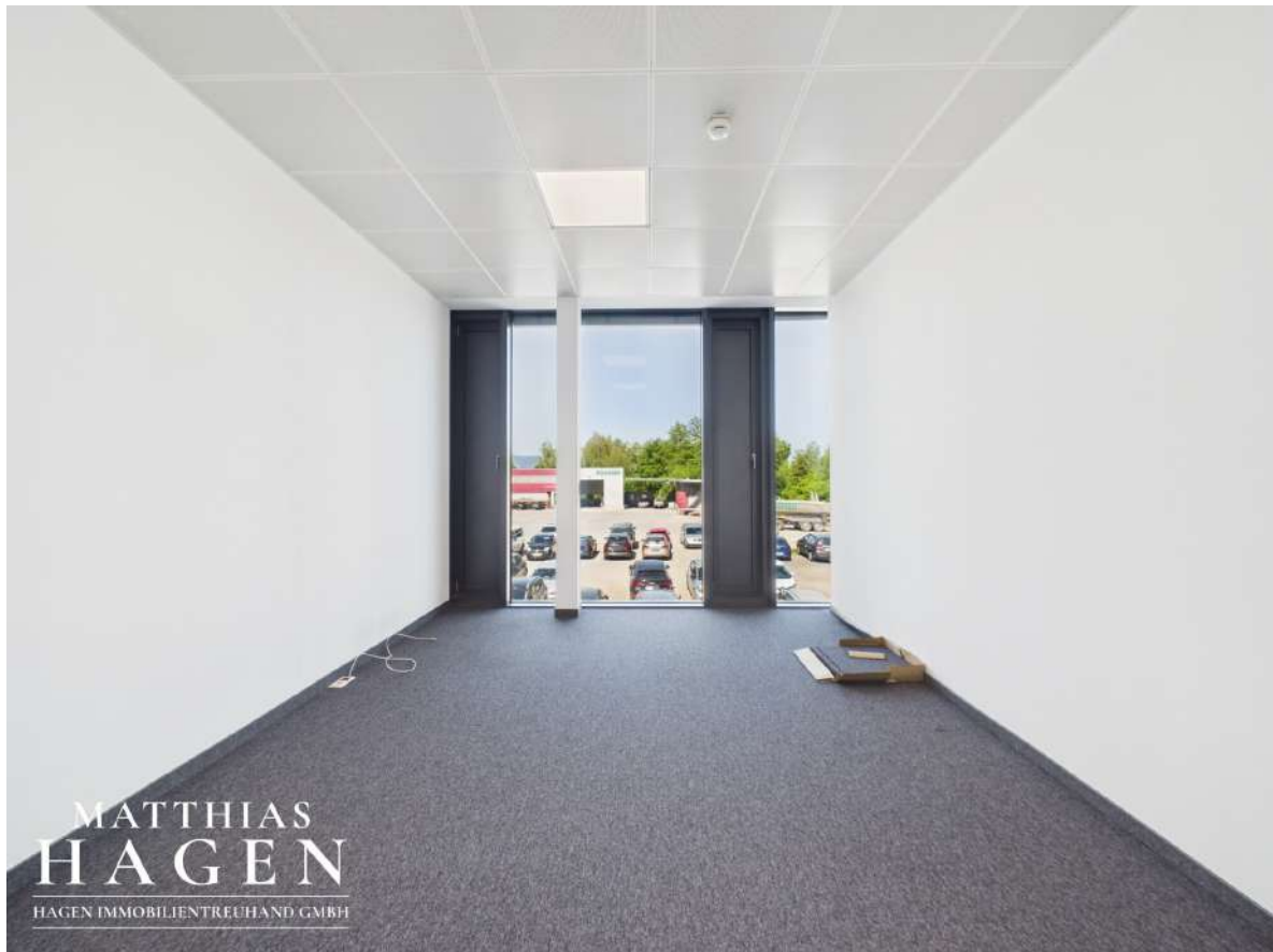
Büro 3 (Top 102,103)