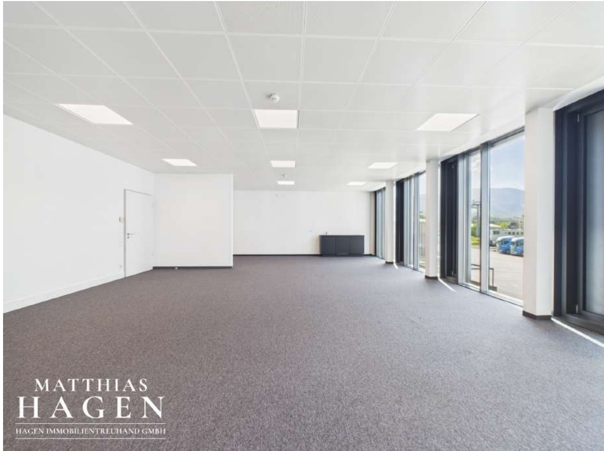
Büro 3 (Top 102,103)