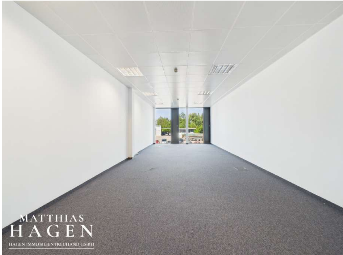
Büro 4 (Top 108)