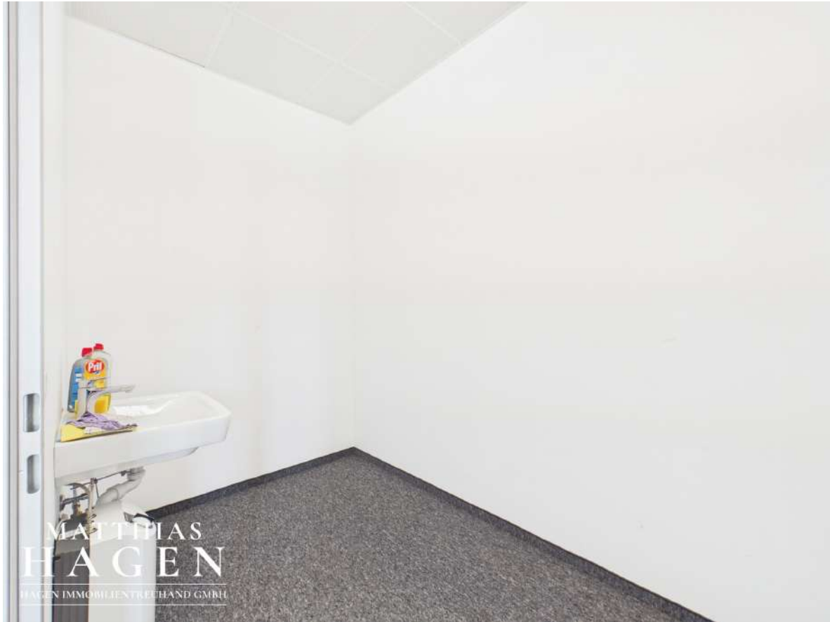
Büro 2 (Top 105)