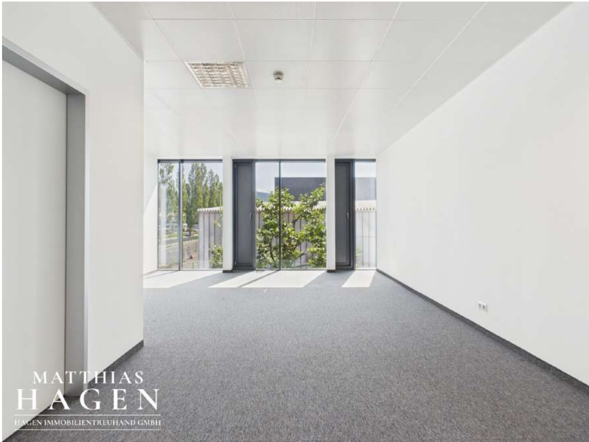
Büro 2 (Top 105)