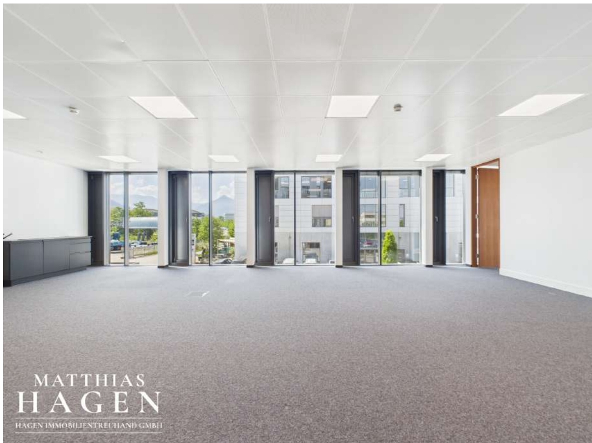
Büro 3 (Top 102,103)