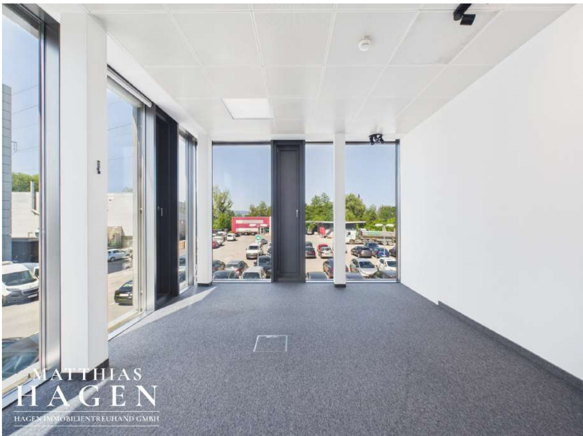
Büro 3 (Top 102,103)