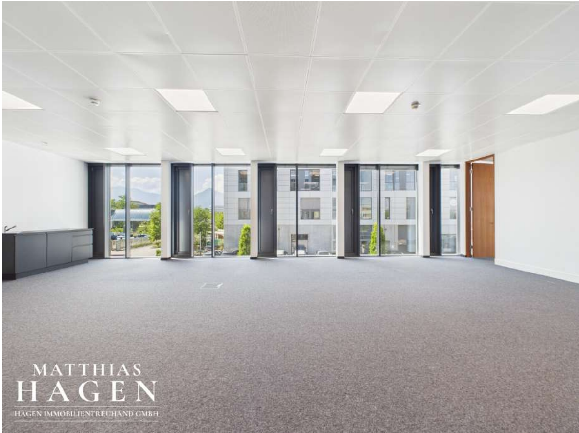
Büro 3 (Top 102,103)