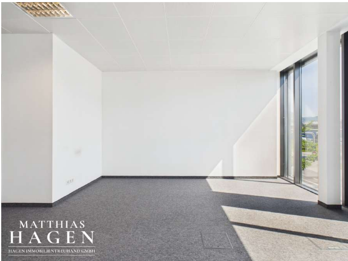
Büro 2 (Top 105)