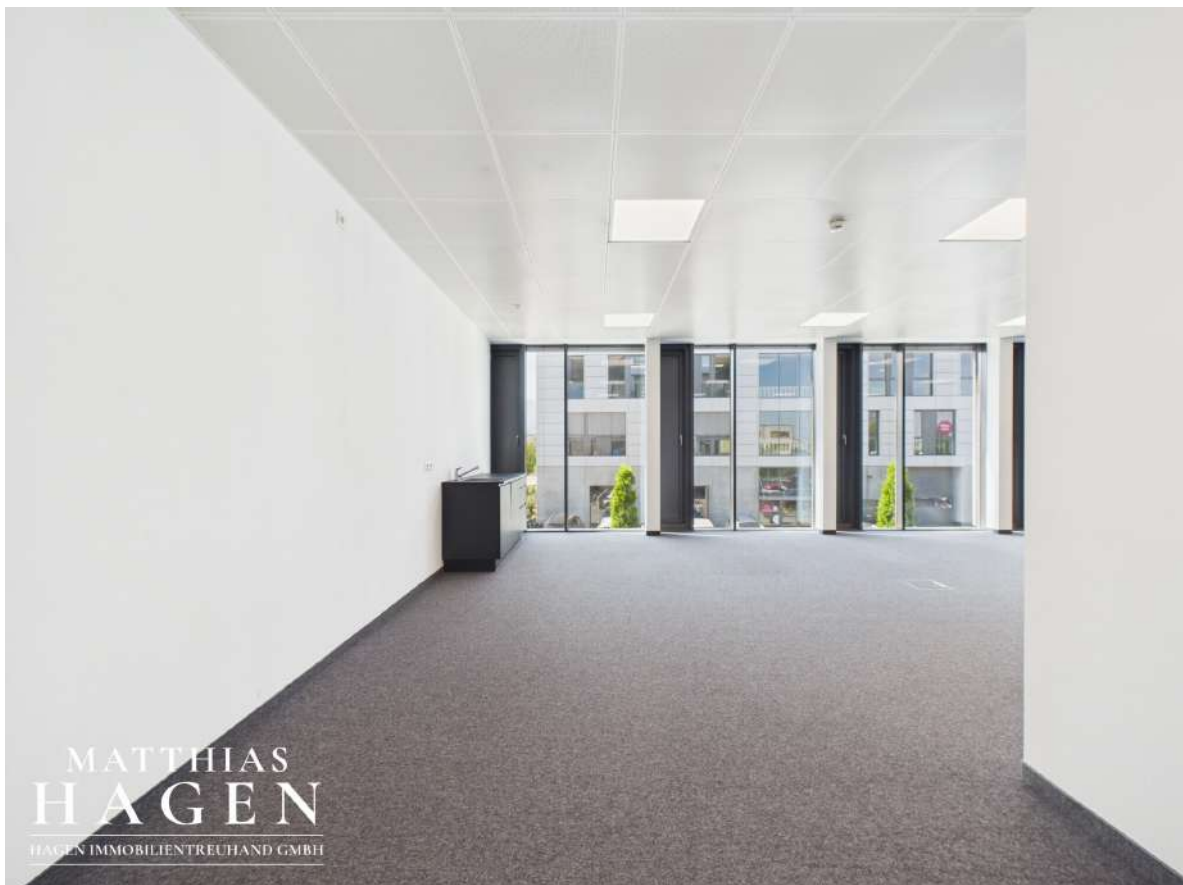
Büro 3 ( Top 102,103)