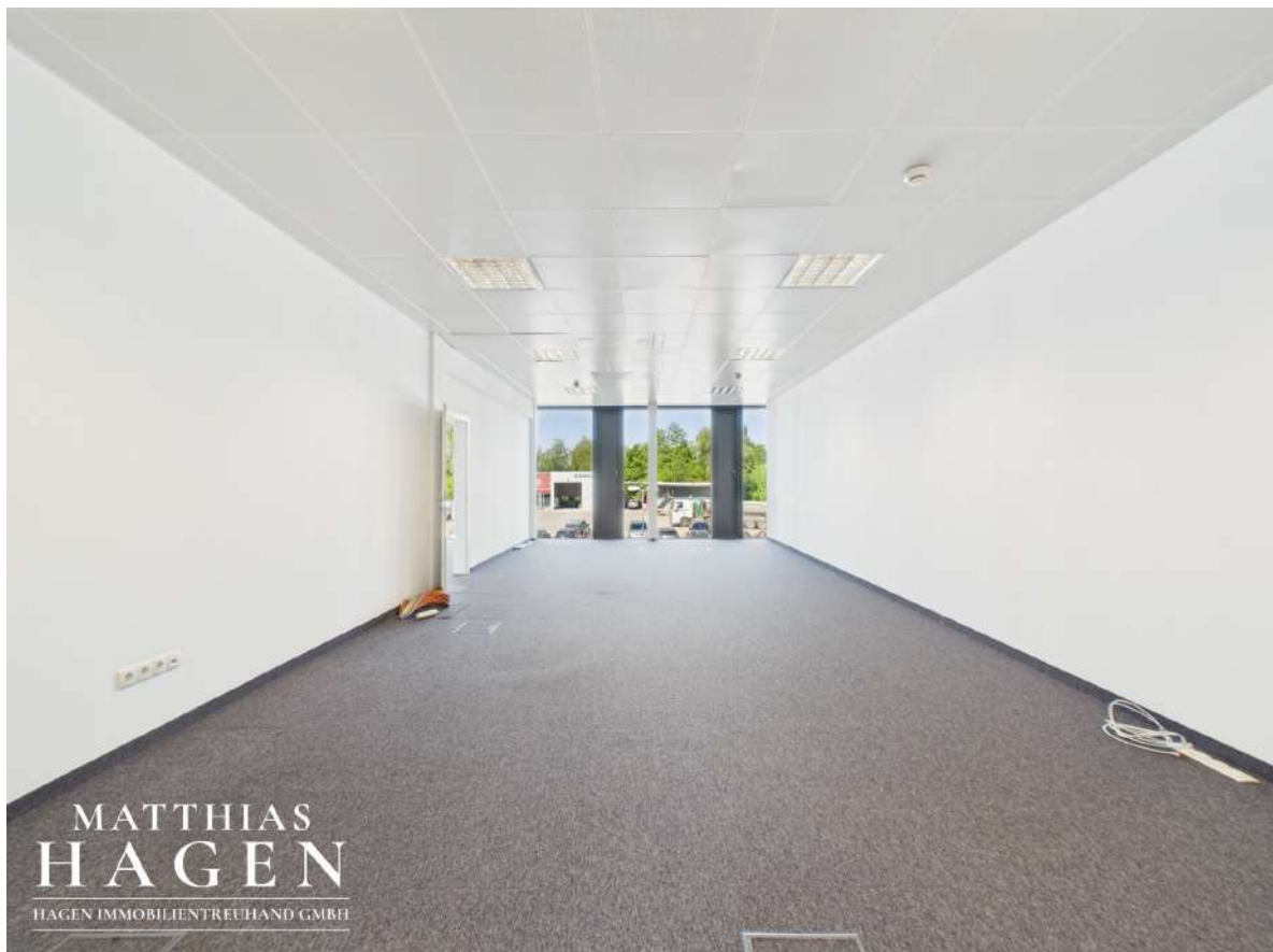
Büro 3 (Top 102,103)