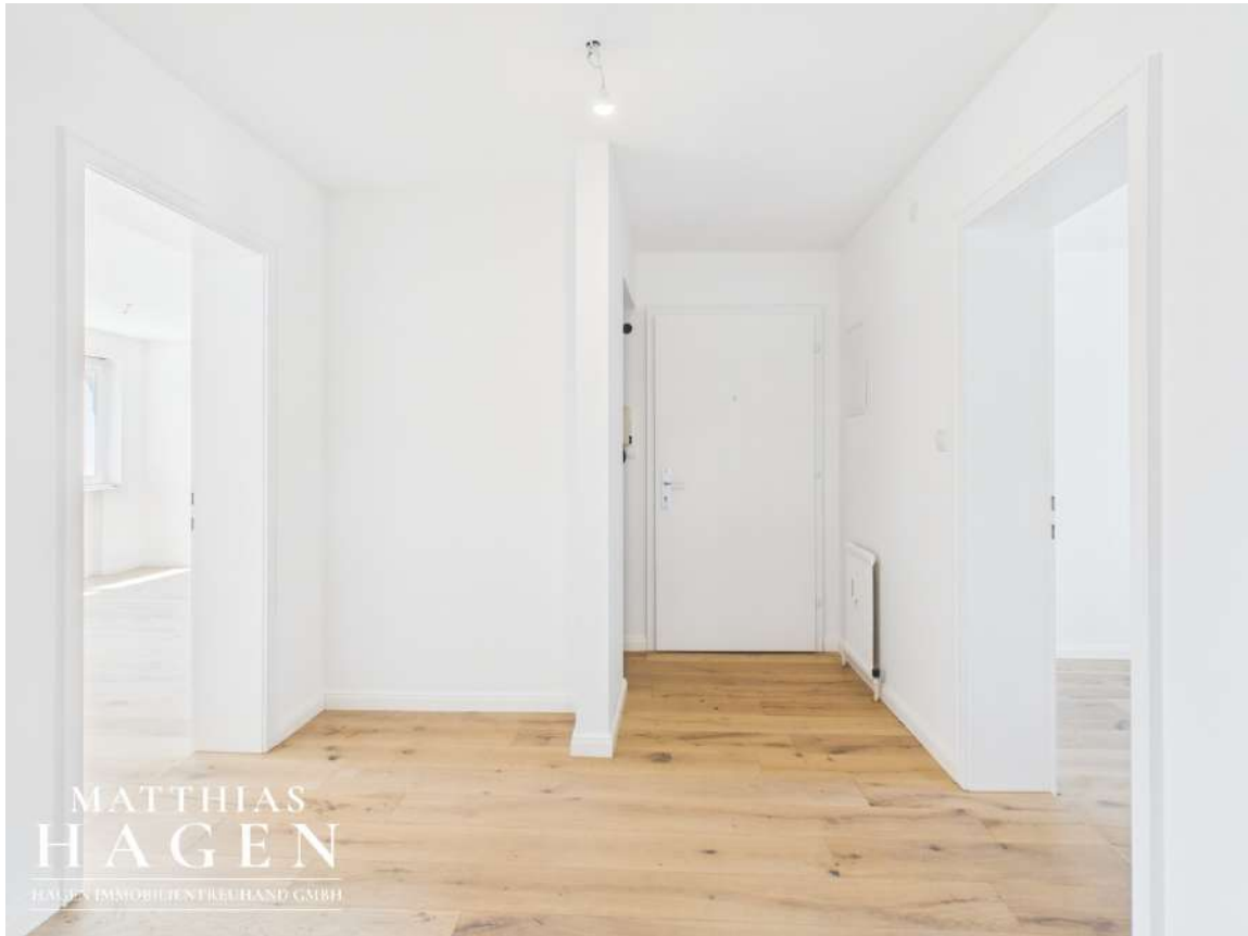
Flur und Eingangsbereich