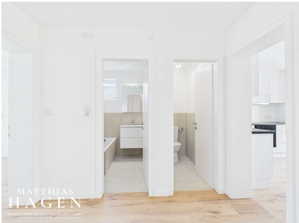
Flur Richtung Bad und WC