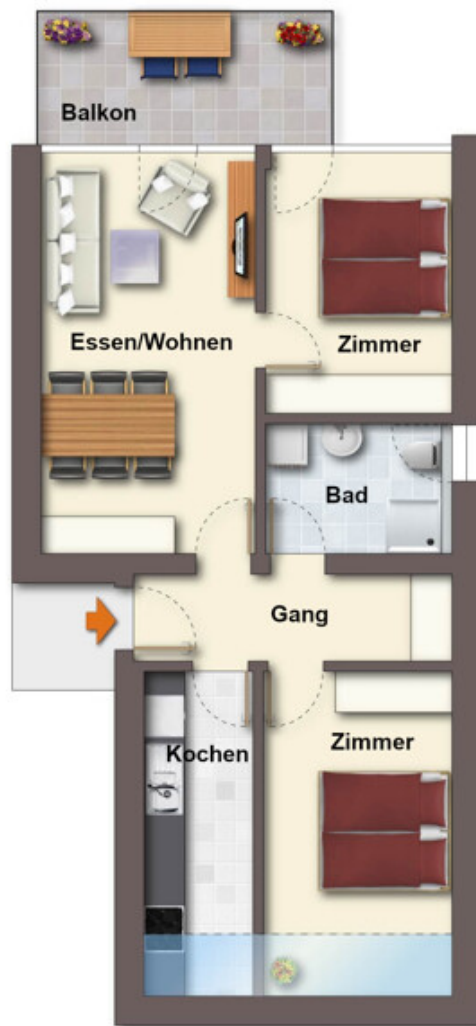
Grundriss ohne Maßstab!