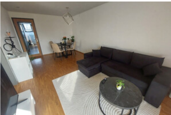
Essen / Wohnen