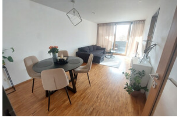
Essen / Wohnen