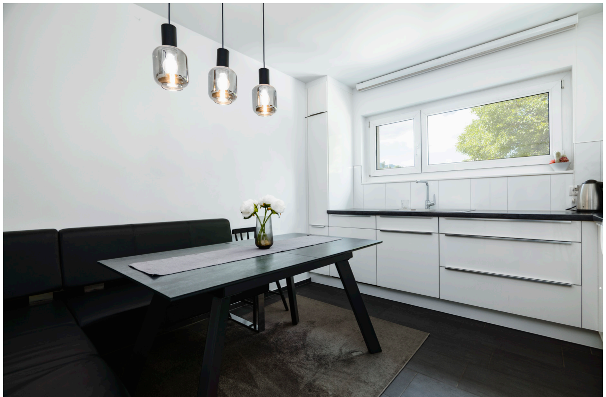
Kochen / Essen