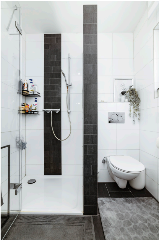
Dusche / WC