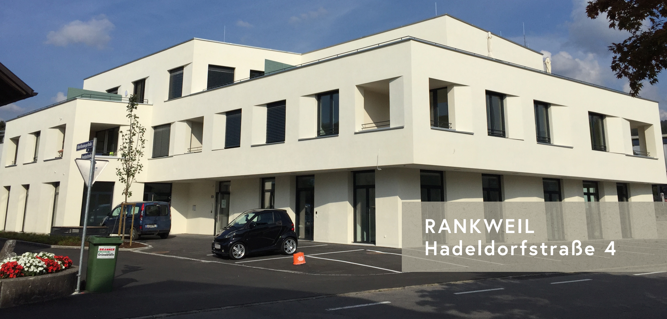
RANKWEIL Hadel Dorfstraße 4