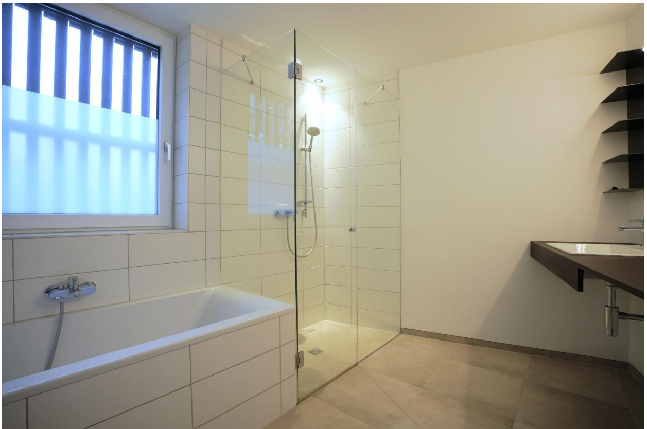
Badezimmer mit Badewanne und Dusche