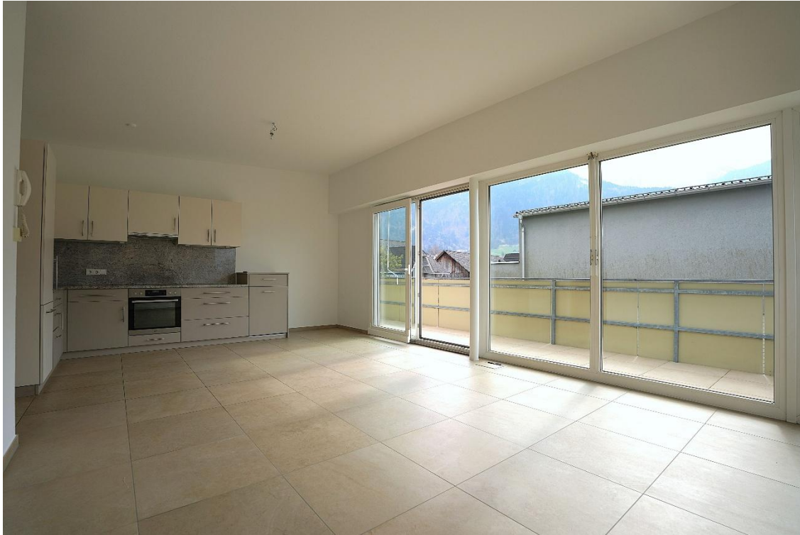
Küche / Essbereich