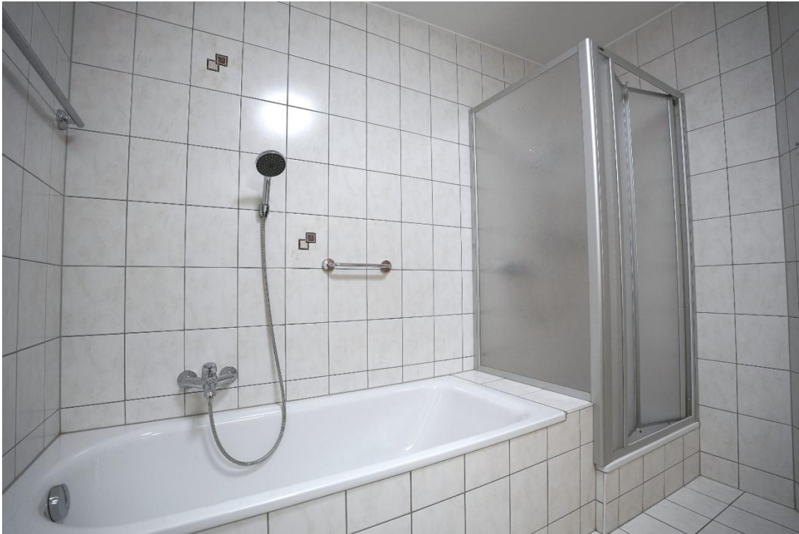
Badezimmer mit Dusche und Badewanne