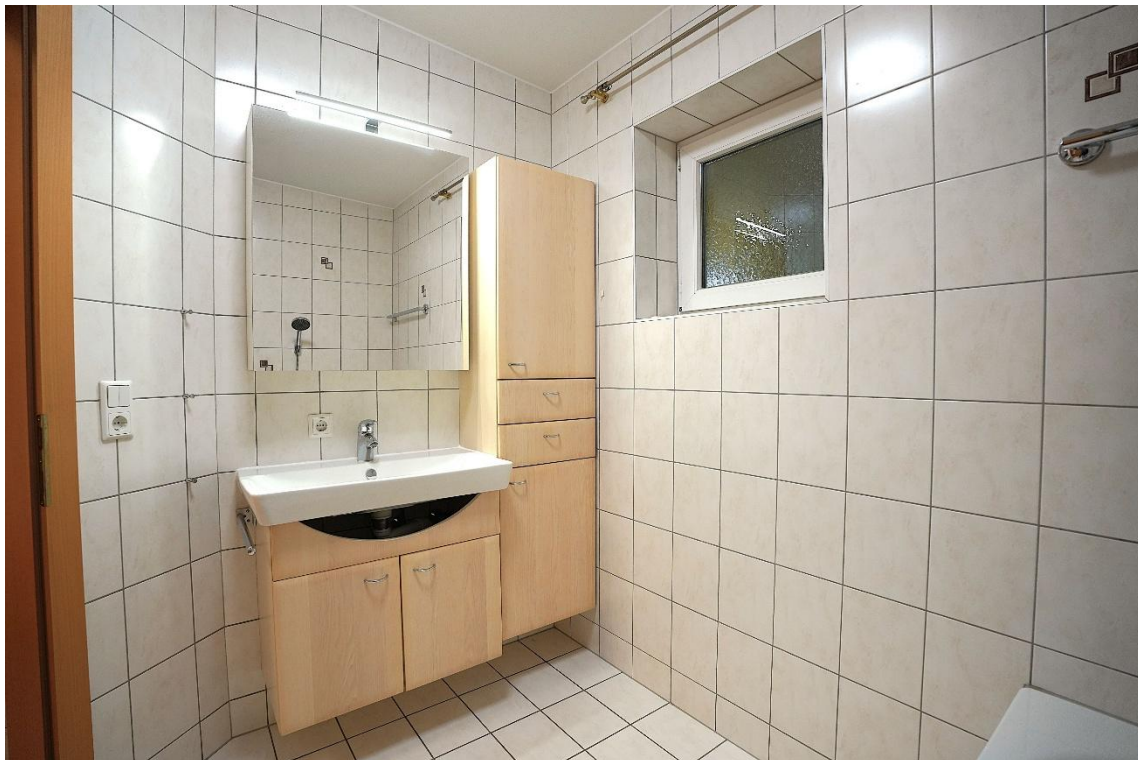
Badezimmerschrank im Badezimmer