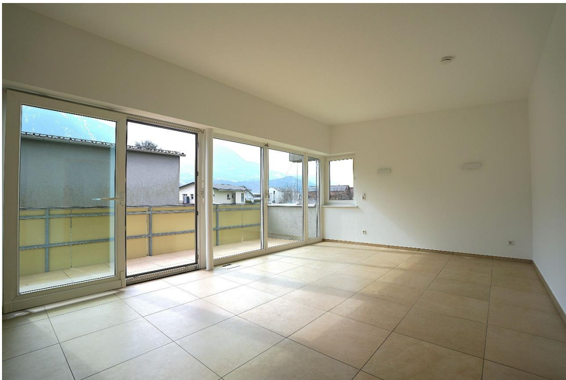
Wohnzimmer / Essbereich