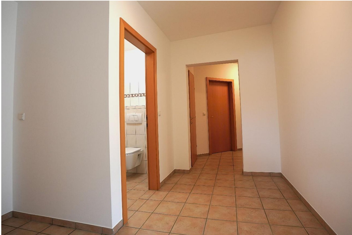
Eingangsbereich / Gang