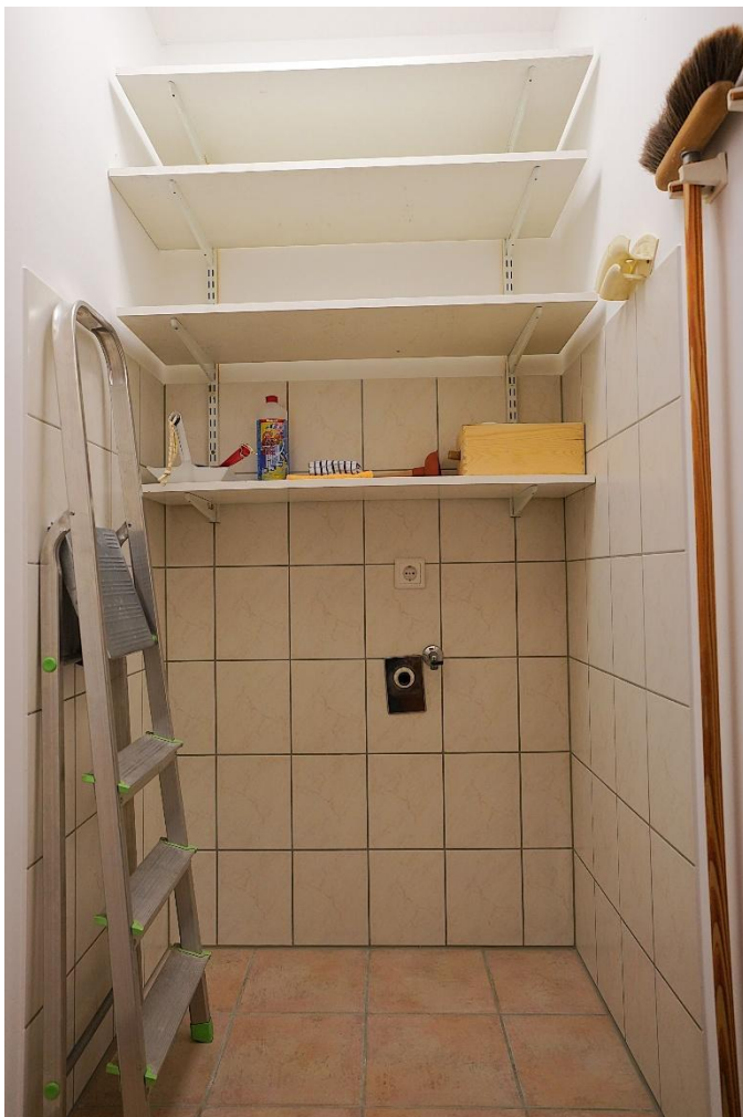
Abstellraum in der Wohnung