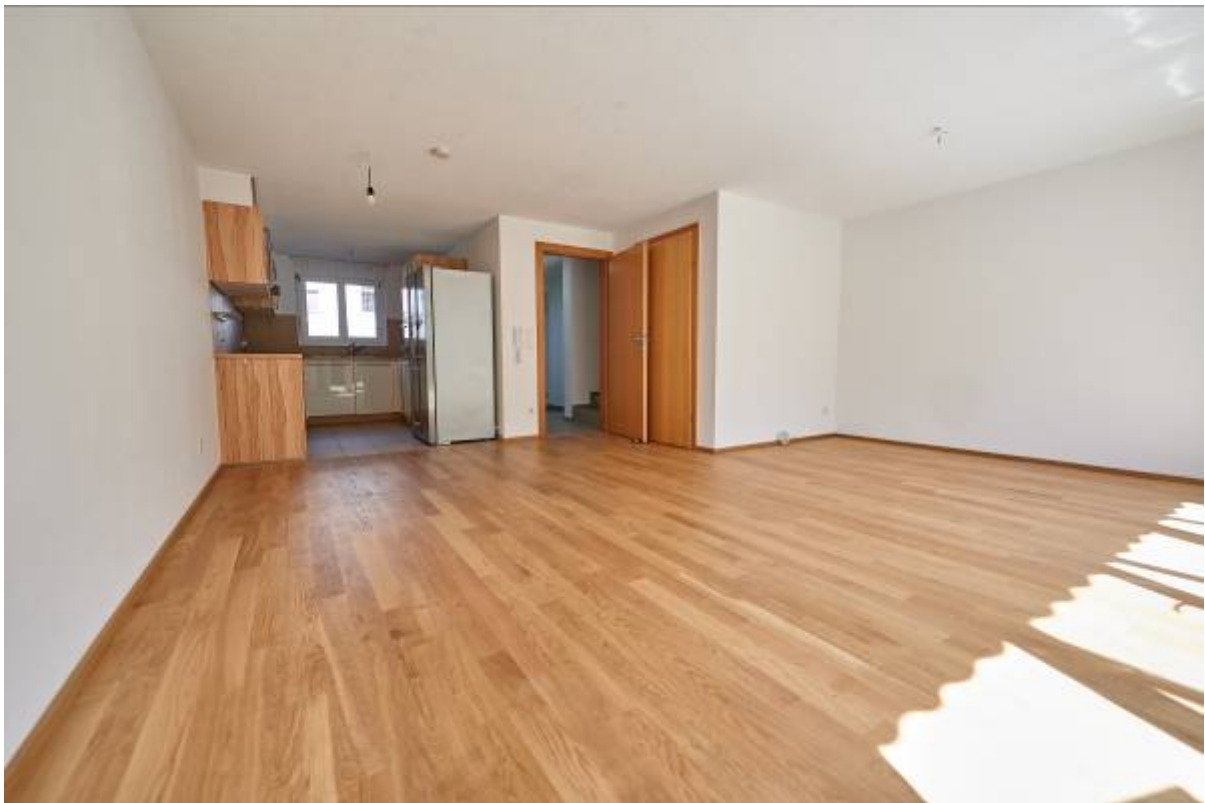
Wohn,- und Essbereich