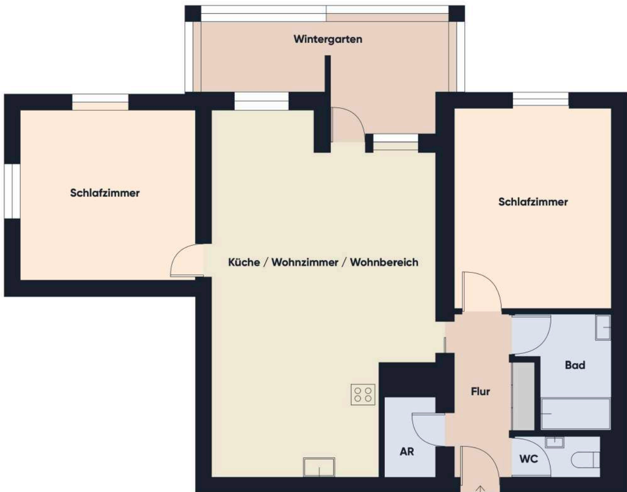
Grundrissplan ohne Maßstab